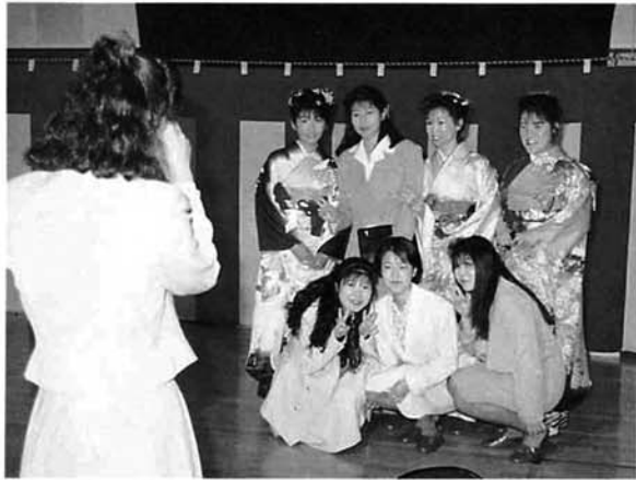
▶会場内ではあちらこちらで記念撮影