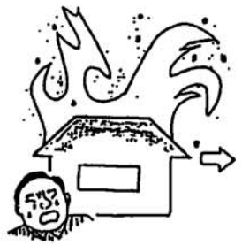
保険料が納められないとき

免除についての手続きや相談は、町役場国民年金担当（☎95-3111）へどうぞ。（保険料免除該当届の提出が必要です。）