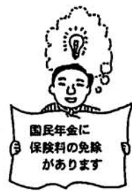
ゆとりができたなら追納しましょう