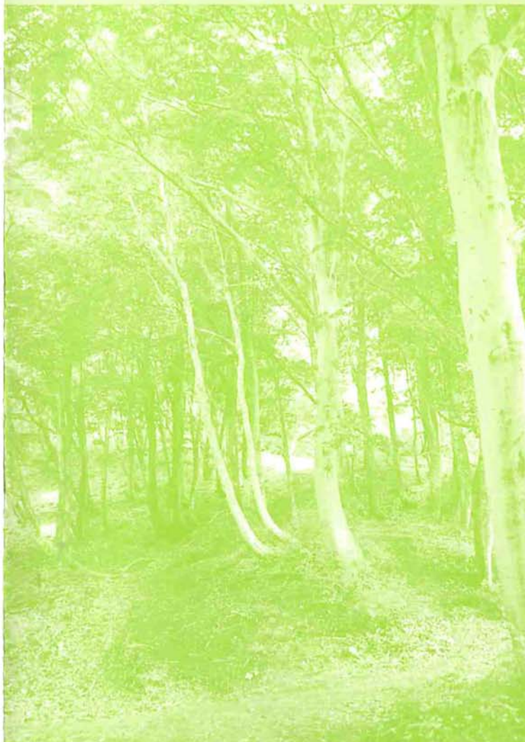
自然の木立をぬって…(八石山遊歩道)