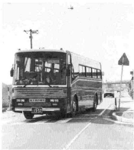
▲観光バスが通るシーズンになりました。

物産館の構想につきましては、いろいろの方式があるかと思いますが、農協・商工会その他とよく話し合い、鋭意努力して参りたいと思っております。