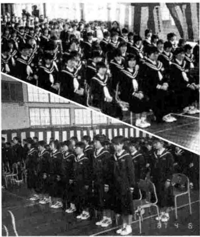
▲中之島北中学校 昭和62年度入学式

いて検討されている段階でございます。建設位置について、いつころまでにお願ひしてあるかということですが、できるだけ早めにお願ひしたい、でき得るならば六十二年の早いうちにと参っております。