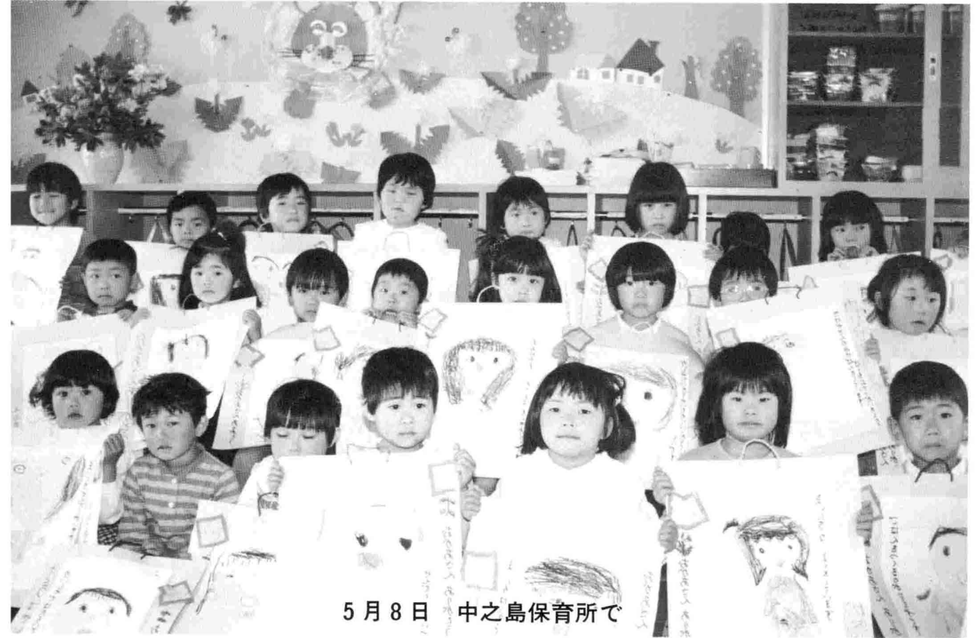
5月8日 中之島保育所で

編集と発行/南蒲原郡中之島町役場企画課 (〒954-01 ☎0258-66-2270)