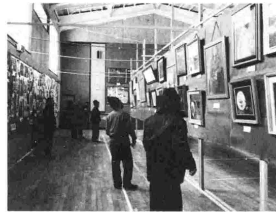
▲盛況でした「村民作品展」 2月16日から20日まで開催された第4回村民展。期間中、天候には恵まれなかったものの大勢の来場者に241点の作品も満足の様子でした。