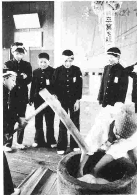
▲「もちつき」で卒業を祝う会が（上通小）