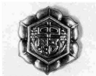
中野小学校の校章

二十代、七十代の出席者からは小学校時代の思い出や、閉校の現在の気持ち、統合校舎の期待や不安など、いろいろな思いや意見が活発に飛びかかっていました。