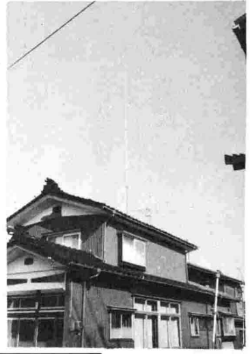
いま学校で⑤ 中之島中学校