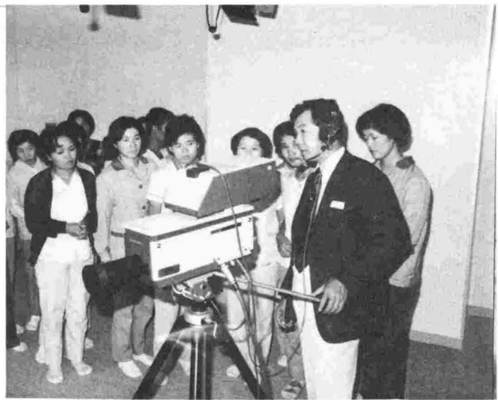
「NHKのスタジオみたい。(視聴覚室で説明を聞く見学者)。」

所得税の予定納税は 十一月三十日まで 所得税第二期分の予定納税は、十一月一日から三十日までの間に納めていただくことになっています。納入金額は、六月に皆さんのお手元に通知してありますから、忘れずに納税してください。