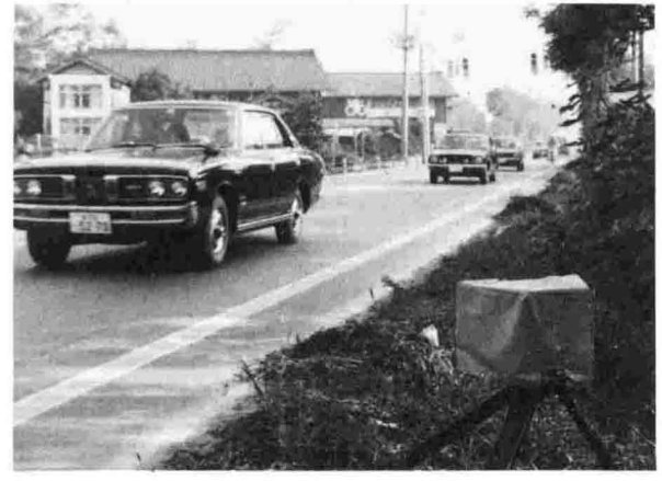
スピード違反の取り締まり(大口)