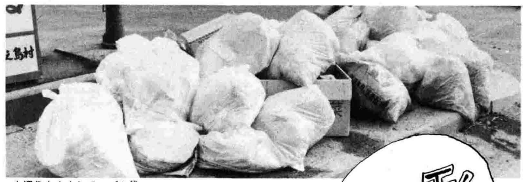
水切りをよくして、ゴミ袋へ。