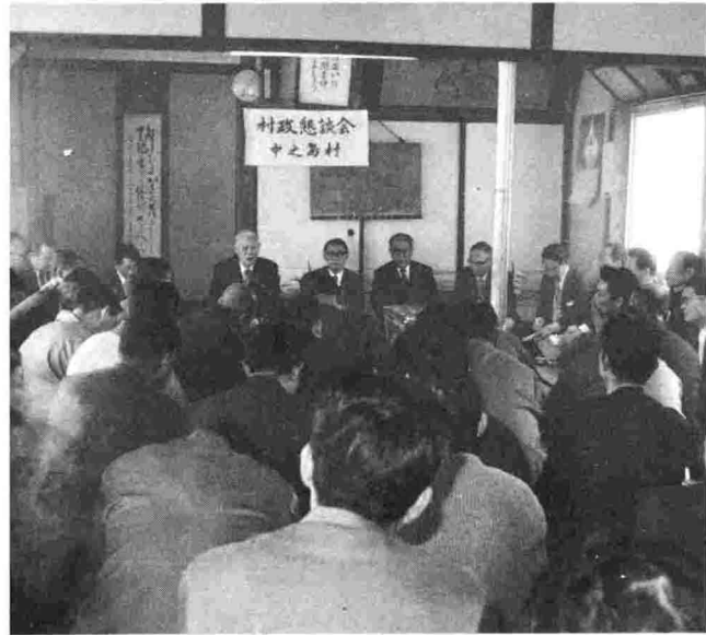
会場はギッシリ、切実な要望が……