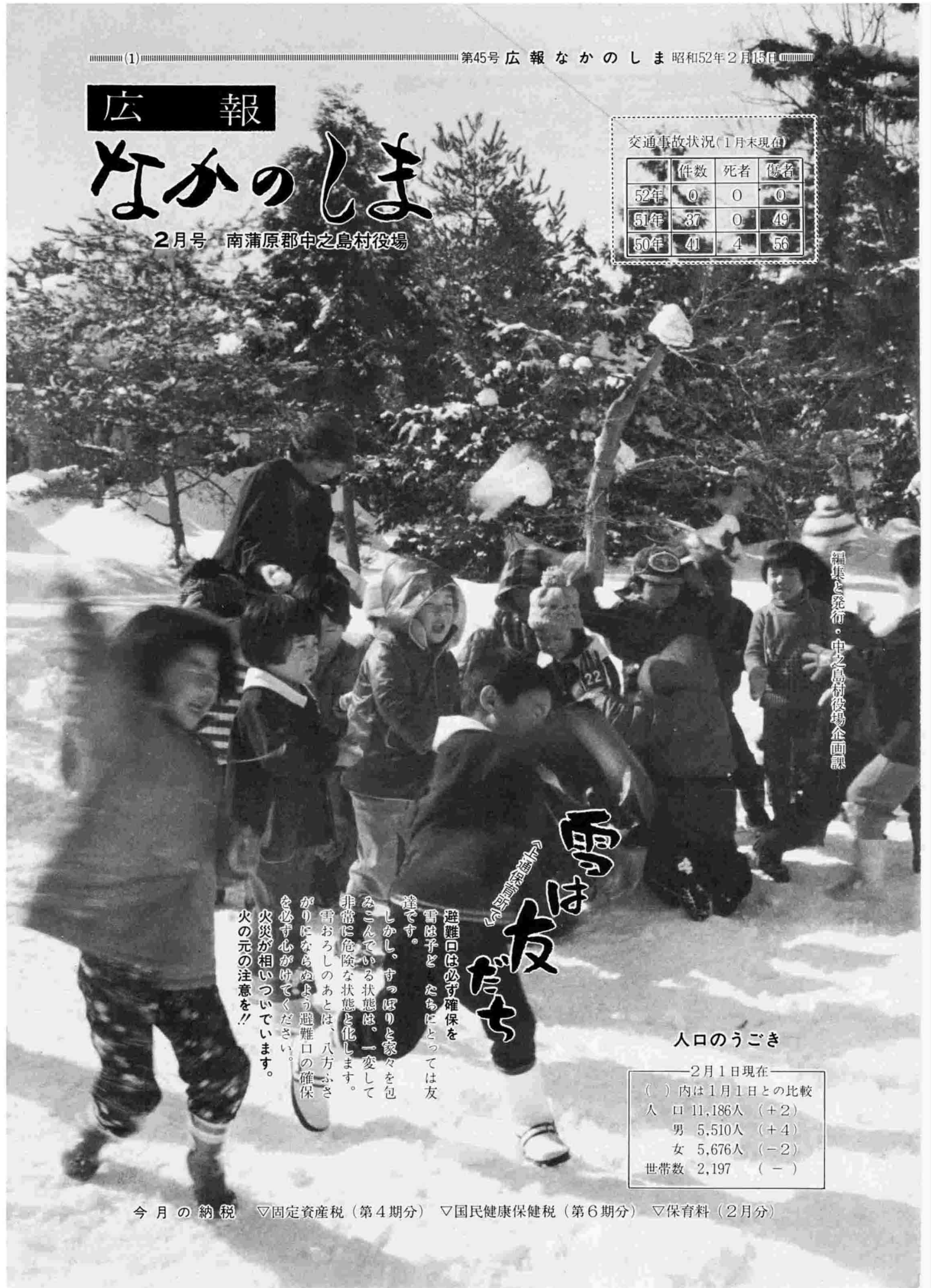
編集と発行・中之島村役場企画課