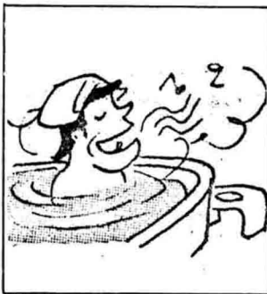
入浴はぬるま湯でのんびりと。(一番ぶろ、長時間はさける。)