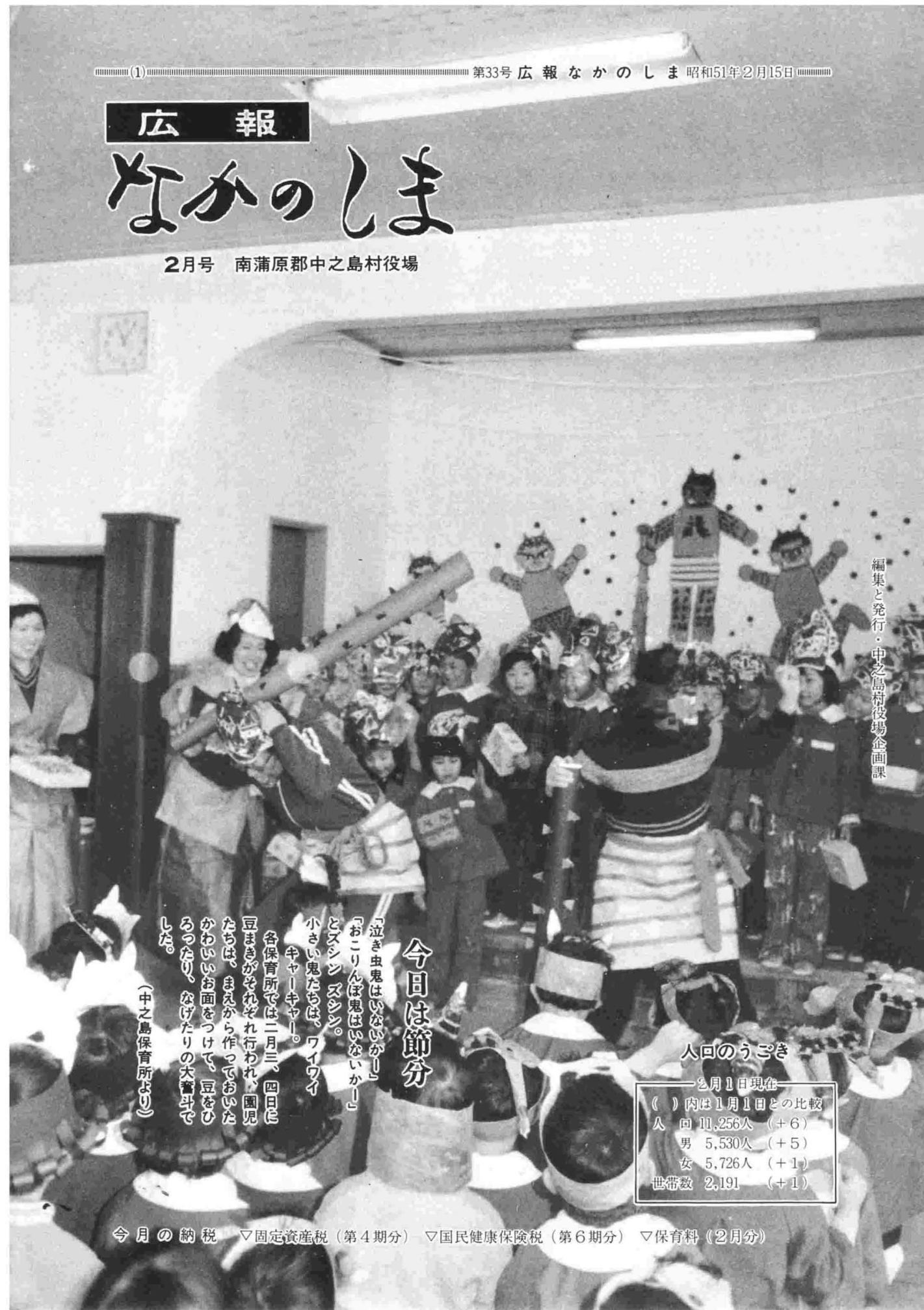
編集と発行・中之島村役場企画課