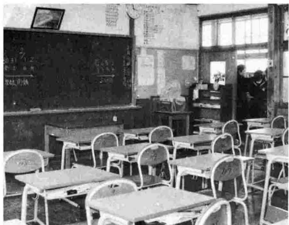
1月30日から2月2日まで学級閉鎖の中之島中・1A