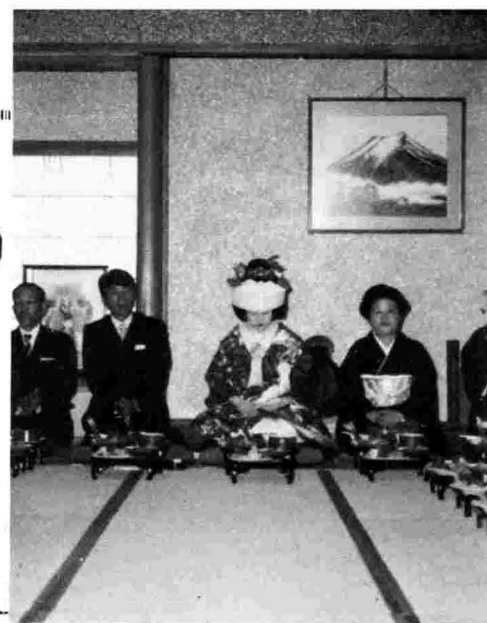
中条地区で生活改善の一つとして行われている公営結婚

虚礼廃止など、生活の合理化を、昨年十一月二十七日に各公民分館長、婦人団体それに青年代表者で「生活改善推進会議」が発足したことは既報のとおりです。