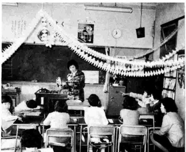
三條小学校の特殊学級から