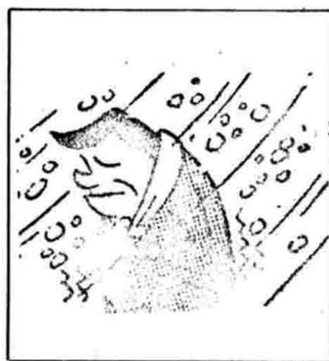
寒さはよくありません。部屋や便所を暖かくして寒さを防ぎましょう。

日頃血圧の高い人は日常生活に次のようなことに充分注意し、また、高血圧などで医師の治療を受けている人は、それ