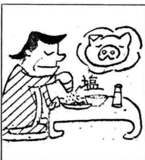
食事は塩分を取りすぎないようにし、バランスのとれた食事を工夫する。

▽手数料は：四百円。 ☆運転経歴証明書の 交付 ▽自分の：無事故、無違反、運転記録、交通違反の現在の点数、運転免許経歴を知りたい方に証明書を発行します。 ▽申請方法は：交通事故証明書の場合と同じです。 ▽手数料は：六百円。 西蒲原郡黒崎町大字山田 一三〇七 県自動車運転免許試験場内 自動車安全運転センター 新潟県事務所