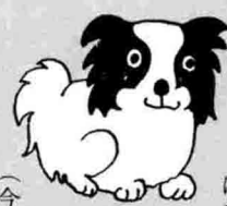
(今町 星獣医師 六一―二四九)

狂犬病予防法により、犬は毎年登録し(生後三か月以上)、春・秋二回の狂犬病予防注射を受けなければならぬことになっています。登録もれの方、あるいは二回目の注射を受けておられない方は、最寄りの獣医さんへ連絡のうえ受けられるよう勧告します。 なお、不用犬として保健所へ出した場合や死亡等で犬を所有していない場合は、役場保健衛生課へ連絡ください。 (三条保健所)