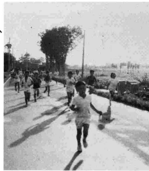
全員完走したおはようマラソン

台風一過のからりと晴れた八月二十四日、第一回の早朝マラソン大会が中之島——島田間に設けられた三コース（二・三・五キロ）によって行われました。