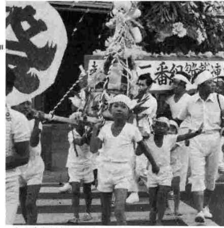
中之島(諏訪神社)まつり

「昔ながらの燈籠を奉納したことから交通が緩和されて押しあいを復活させようではないか……」という意見がまとまり今年の押しあいとなったものです。