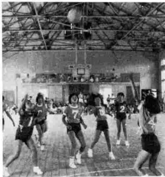
父兄のほうに熱心な少年球技大会