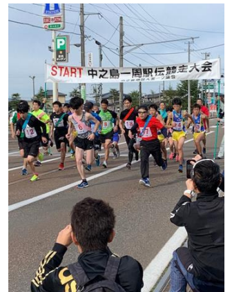
令和元年のスタートの様子