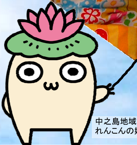
中之島地域マスコットキャラクター れんこんの妖精「なかのん」♪

上通保育園でもちつき会が行われました。 商工会のみなさんと年長園児でついたお餅は もっちもち♪みんなでおいしくいただきました。 (12月11日)