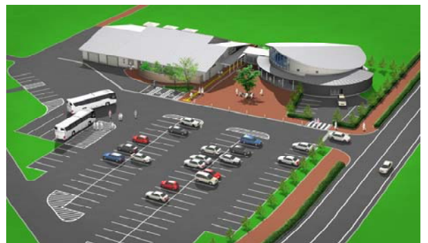
▲平成25年秋オープン予定の「道の駅」【イメージ図】