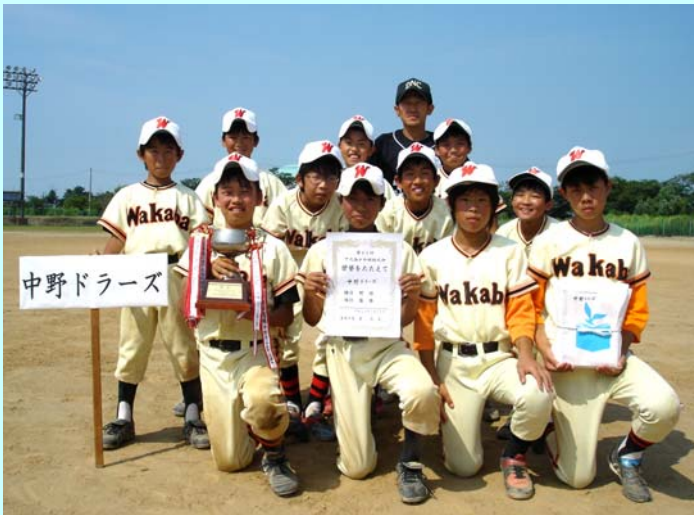
▲優勝した 中野ドラーズ

優勝 上通ブルックス 準優勝 はばたけA信条 第3位 上通ラビッツ 第3位 上通ロッカーズ