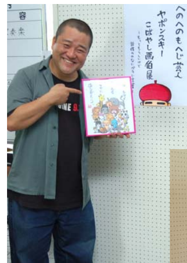
▲小林画伯本人も来場！！

◀へのへのもへじの文字を使って絵を描くこぼやし画伯のロビー展(～7/31)が中之島文化センターで始まりました。6/30・7/1には、こぼやし画伯本人も来場され、ロビー展へ来られた方々と談笑されました。