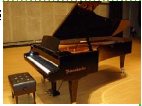
▲ベーゼンドルファー Mod.275