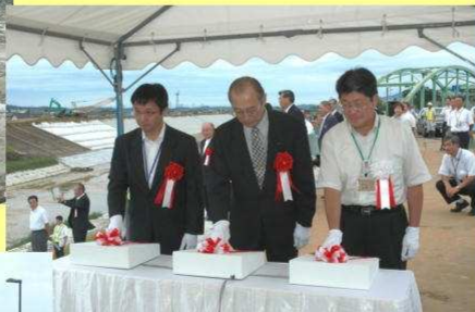
▲関係者による合図により通水作業が開始されました。

川の流れる瞬間を見ようと約400人が集まり、新河川に通水され、新しい河川の誕生に大きな歓声と拍手が起こりました。