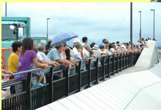
◀中之島大橋には多くの方が集まり、通水の瞬間を見守りました。