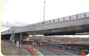
▲建設中の中之島大橋。開通式当日は、どのような姿を見せてくれるのか楽しみです。