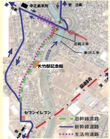
▲1月27日(火)午後3時切替後の交通体系

県道への迂回路は、中之島支所前を通り、新橋「中之島大橋」と「今町大橋」の2つの橋を経由する道になります。