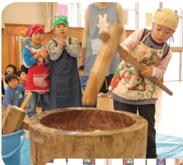
「上手につけるかな」 ◀上通保育園