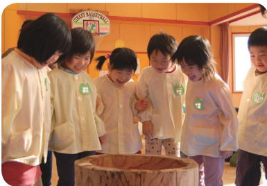
「おもちおいしそう。」 ◀中条保育園