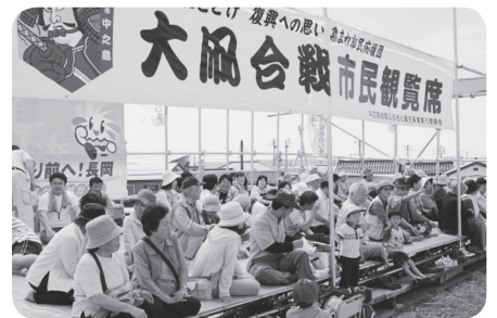
▲昨年の市民観覧席は多くの方々よりご利用いただきました。