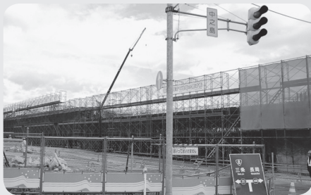
▲建設工事が進む中之島大橋のようす

現在工事の進む刈谷田川改修工事の進捗状況、廃川敷部分となる3分の利活用について、中之島地域案を基に今後見附市、県と協議・検討していく方針を伝えました。