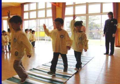
▲横断歩道は手を挙げて渡ろうね。