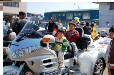
▲ハーレーに乗って記念撮影。