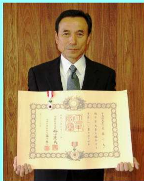
▲ご家族の方による代理での受章となりました。