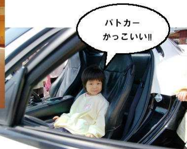
▲バトカーに乗っちゃいました。