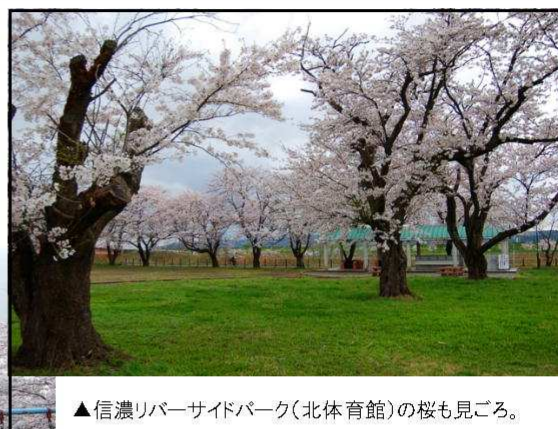
▲信濃リバーサイドパーク(北体育館)の桜も見ごろ。