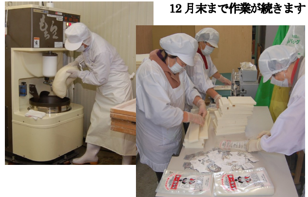
12月末まで作業が続きます

組合員のみなさんは「交代で作業し、多い時は1日に500g入りの切りもち600袋を作ります。『大正もち米』を改良した『新大正もち米』を使い、“きね”で丁寧につきあげたおいしいおもちです。心を込めてお届けします」と話していました。