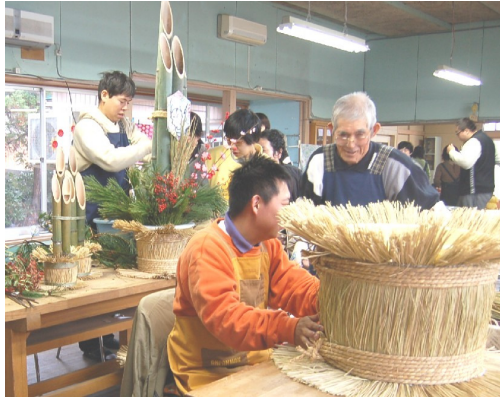
竹の切り口を揃えるのに苦労します

中条地区にある福祉作業所「虹の家」ではお正月用の門松づくりで大忙しです。毎年、約55センチのミニ門松を150個程製作します。今年は長岡郵便局に約180センチの大きな門松を納めました。前を通られたらぜひご覧ください。