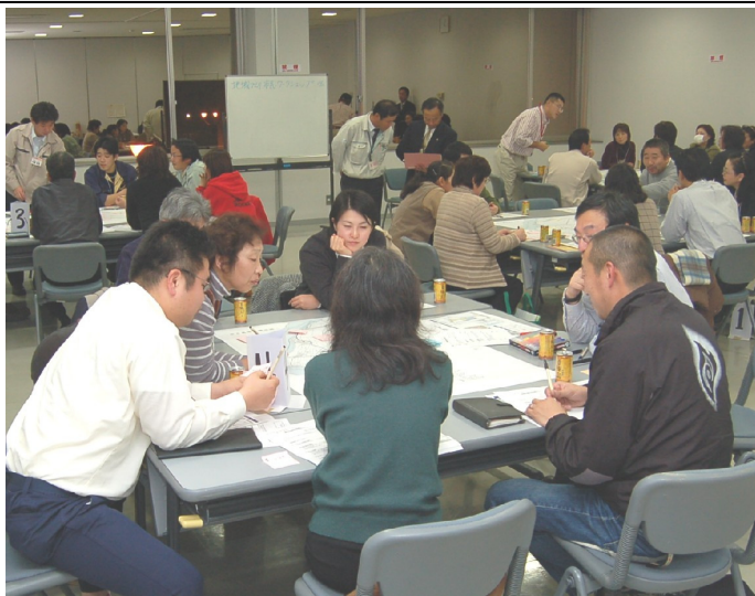
5グループに分かれて『地域の宝もの』を話し合いました。景観、歴史、農産物などであまり知られていないものや意外なもの、たくさんの『宝もの』についての発言が相次ぎました。(12/12 中之島文化センター)