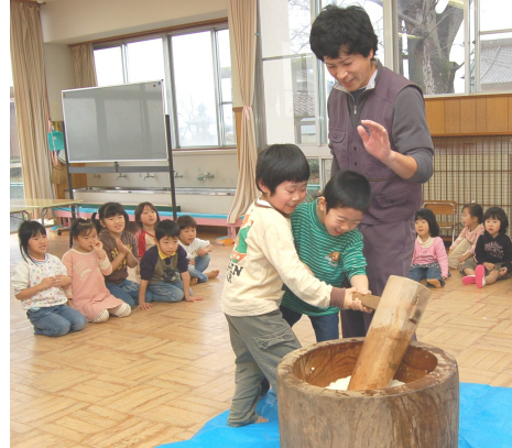
べったんべったん 上手につけたよ

12月14日、上通保育園で「もちつき大会」を行いました。商工会青年部・女性部の皆さんが、きねとうすでおもちつき。年長組の園児も「よいしょ！よいしょ！」とお手伝いしました。つきたてのおもちは、きなこもちとあんこもちになり、みんなでひと足早くお正月気分を味わいました。