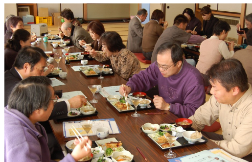
中之島産のれんこんも小松菜なども作った料理を味わいました

11月25日、中之島農村環境改善センターで「れんこん料理の昼食会と大風の展示」を開催しました。市内から25名が参加、中之島の味を楽しんでもらいました。