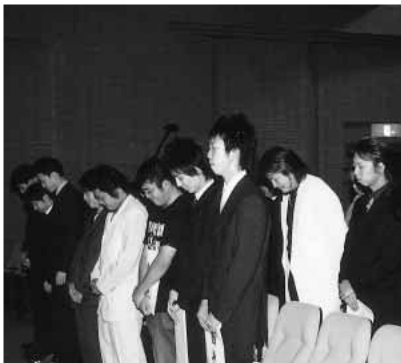
▲式典に先立ち「7.13水害」でお亡くなりになられた方々に黙とう