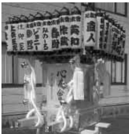
心友会の「万灯みこし」▶

財団法人自治総合センターが実施している「自治宝くじ」の収益を財源とした「平成16年度コミュニティ助成事業」によって、中之島夏まつりで活躍している「心友会」が『万灯みこし』を整備しました。