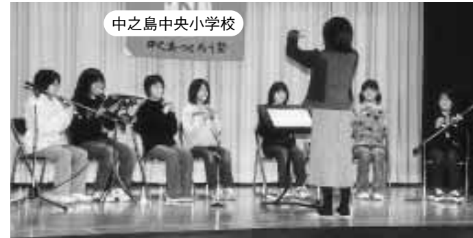
中之島中央小学校