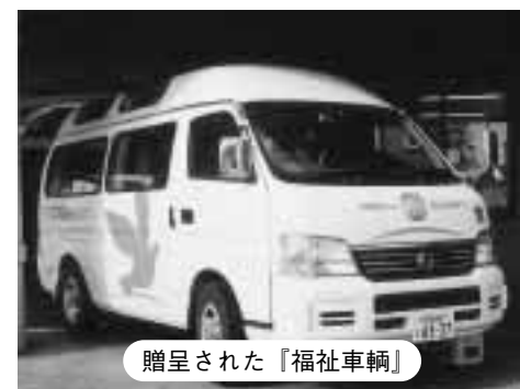
贈呈された『福祉車両』

このたび、町社会福祉協議会へ全国で展開された「24時間テレビ26」に集まった募金から『福祉車両』が贈呈されました。今後、この福祉車両は町の