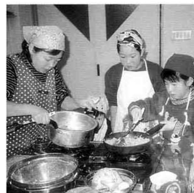
▲お父さんやお母さんとも一緒に料理しました

国民健康保険事業の一環として行ったこの料理教室には、当日11組の親子・29人が参加。会場の農村環境改善センター・調理実習室で、親子で協力しながら、栄養たっぷりのパンフキンコロッケや中華風ドライカレーなどを調理・会食し、和気あいあいとみんなで楽しいひとときを過ごしました。