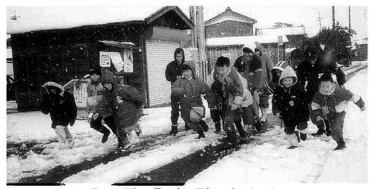
▲1月1日正午、雪の中を元氣よくスタート！

当日は、灰色の空から雪が降りしきるあいにくの天候となりましたが、子どもたちにとっては雪など何のその。カラフルなスキーウェアなどを着込んで、元氣良く走り切りました。