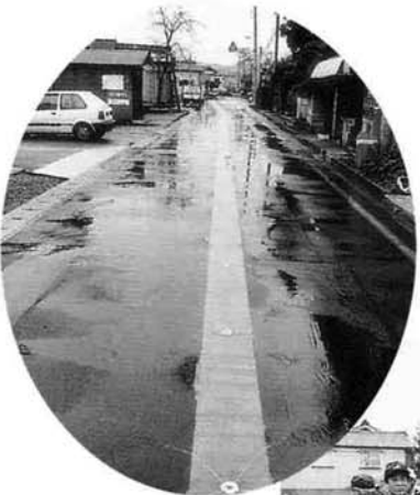
▶ 12月28日に行つた消雪パイプの通水式

安全で快適な冬期間の交通確保を図るため、国の補助を受けて取り組んだこの事業は、事業費7,100万円、総延長1,750mに及ぶものです。年明けから雪の日が多くなっていますが、通勤・通学の足の強い味方となることでしょう。