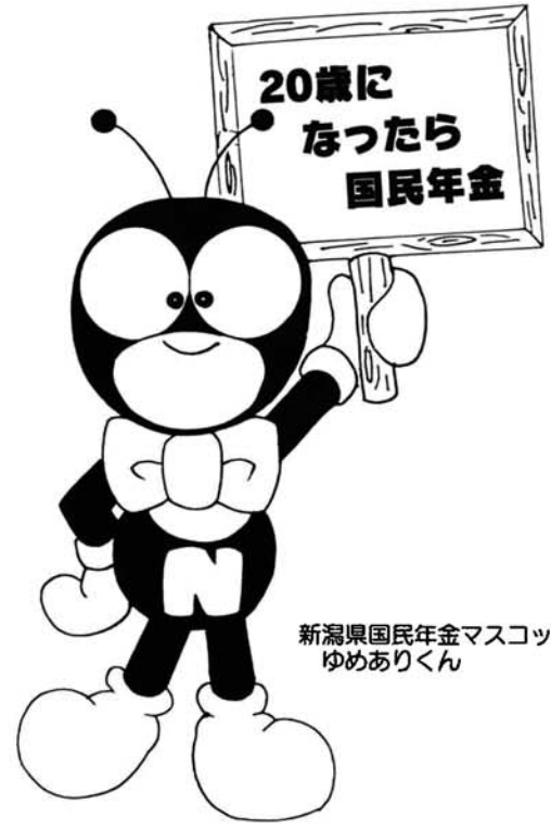
新潟県国民年金マスコット ゆめありくん

しかし、誰にでも老年を迎える日が必ず来るのです。後になってあわてないためにも、年金は若いうちから備えておくことが大切です。老後の老齢基礎年金はもちろん、万一、