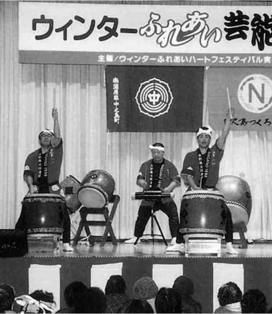
中之島和太鼓クラブ 「響」のみなさん