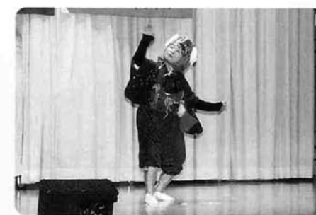
踊り「越後獅子の唄」〈食生活改善推進協 議会〉