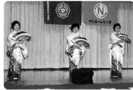
踊り「虹の海峡」〈芸能協会（横山樓会）〉