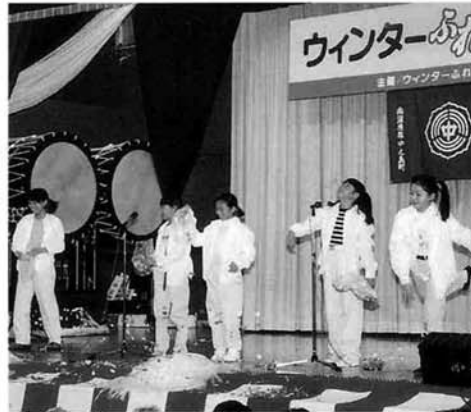
信条小学校4年生のみなさんによ る歌と踊り「WHITE LOVE」(上) と「STAMINA」(右)

出演者のみなさん、そして、企画・運営にあたった「中之島つく ろう塾」委員のみなさん、本当にごころさまでした。