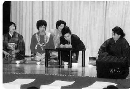
寸劇「草枕」〈ヒラリメート寸劇部〉