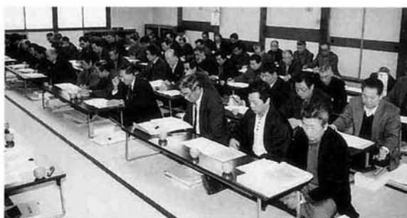
公民館大広間で開催した「緊急生産調整推進対策」囑託員会議の様子