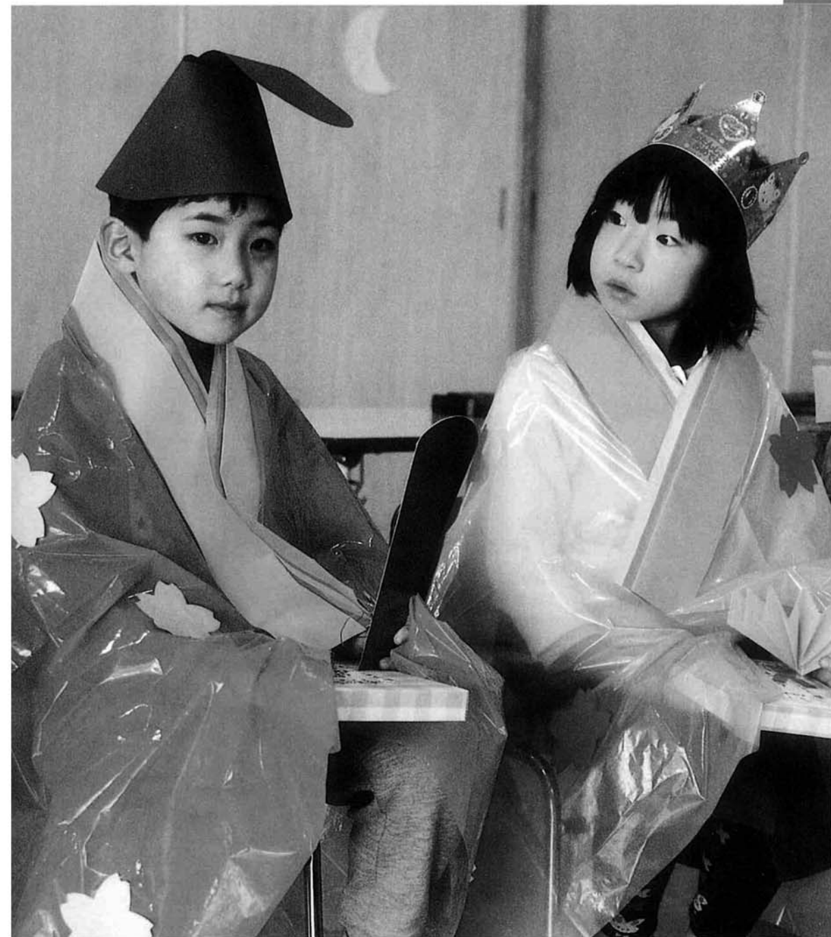
3月3日(火)、信条保育所「ひなまつり会」から