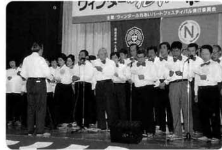
歌「青い山脈」〈中之島つくろう塾〉