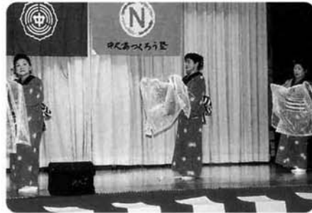
踊り「しのび川」〈芸能協会（秋櫻会）〉