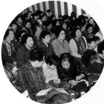
本当に多くのみなさんが来館されました