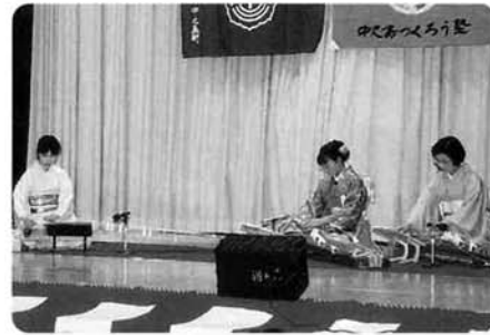
琴演奏「春の訪れ」「つるのおんがえし」 〈松澤社中〉