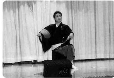
舞踊「望郷太鼓」〈商工会（青年部）〉