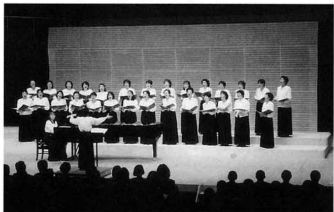
長岡リリックホールのコンサートホールで2曲を合唱した「越のコーラス」のみなさん

この交流会に、当町の合唱サークル「越のコーラス」のみなさんが昨年に引き続き出演し、