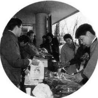
農産物ショッピングコーナー