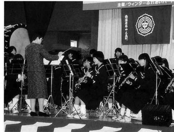
「空も飛べるはず」 など3曲の演奏を聴 かせてくれた中之島 中学校吹奏楽部35名 のみなさん