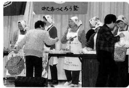
寸劇「はばたけ夕市パート2」〈農村婦人グ ループ協議会（虹の会・北部）〉