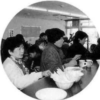
ホットサービスコーナー