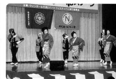
踊り「いもがらぼくと」〈消費者協会〉