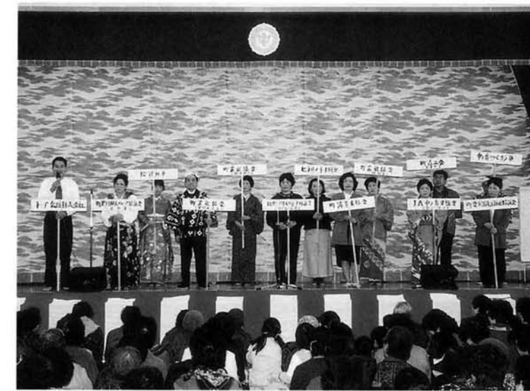
出演団体・グループの代表者からの一言メッセージ