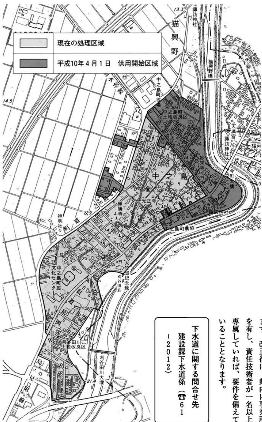
公共下水道終末処理場「中之島浄化センター」