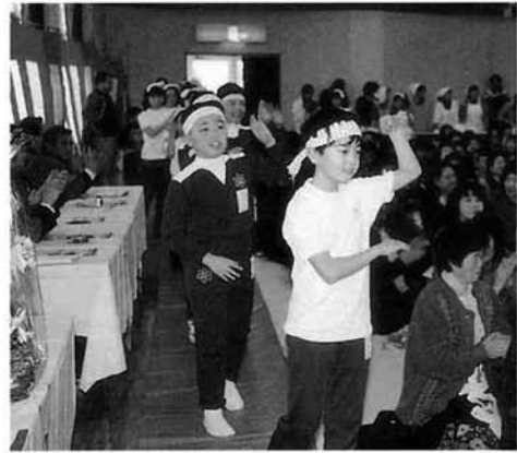
上通小学校4年生42名のみなさんによる 踊り「れんこん音頭」