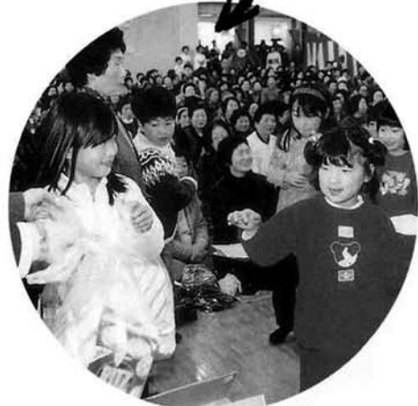
おみやげをもらってにっこり!