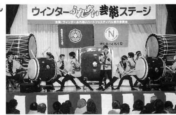
こしじ巴太鼓のみなさん