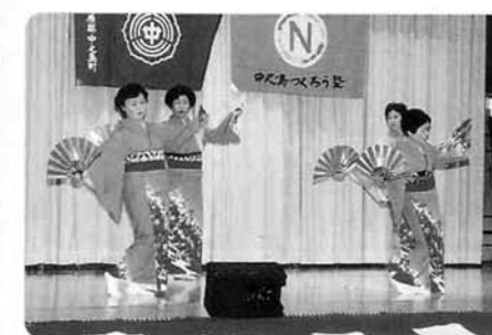
踊り「恋千鳥」〈JA女性部（わかば会）〉