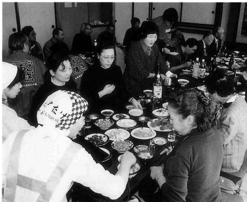
「れんこんのタルタルソースかけ」や「れんこんコロッケ」など町特産品のれんこんを使った数々の料理……参加者のみなさんから中之島の味覚を十分に満喫していただけたことでしょう

光部会が主体となり、その企画と運営にあたるこのツアー。見附市・中之島町の「オリジナル」には、東京中之島会々員を含む11名のみなさんが参加しました。