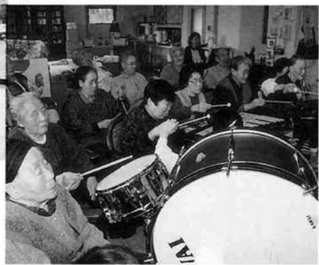
デイサービス利用者のみなさんもさまざまな楽器を使って「うれしひなまつり」を合奏しました