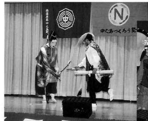
中野東神楽会のみなさんによる 「手杵」(左)と稚児舞「花献」(右)