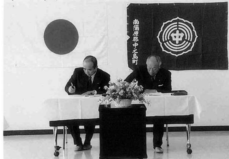
中之島第2流通団地進出協定調印式

立地条件をいかし、ここを流通の拠点としたい。地元雇用も図り、一日も早く操業を開始したい」などと、進出にあたっての企業側の抱負が述べられました。