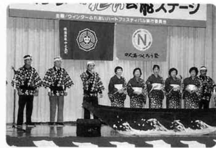
民謡「斉太郎節」「ソーラン節」〈芸能協会 （中野火詣会）〉