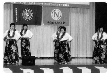
踊り「やびらトゥルルンテン」〈農村婦人 グループ協議会（蓮風会）〉