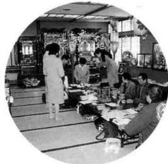
特産品展示販売コーナー