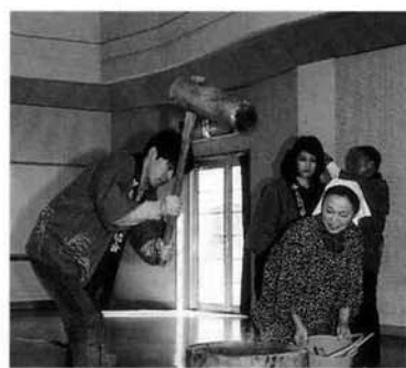
多目的ホールではもちつき体験も

生会館での全体開講式、同市内の酒蔵見学の後、宿泊地である見附市海の家へ。オリジナル風作りや夕食会などで交流を深めました。