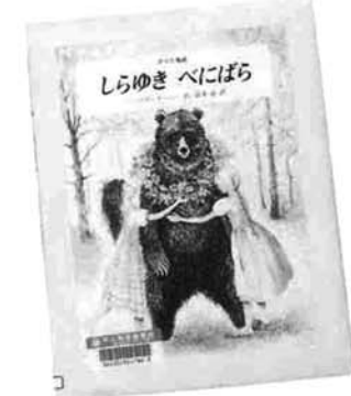
バーバラ・クニー 絵 そうです。ロマンチックな絵でも楽しんでいただけます。