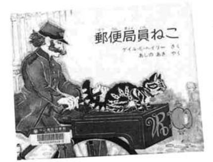
ゲイル・E・ヘイリー 作

郵便局員ねこ 冒険心旺盛な猫クレアは、ミルク運搬車にもぐりこみ、ロンドンまでやってきました。暖かい住家を探してたどり着いた王立郵便局では、そのころ大変な騒ぎが持ち上がったのでした。猫が郵便局員に？ これは、イギリスで本当にあった話です。