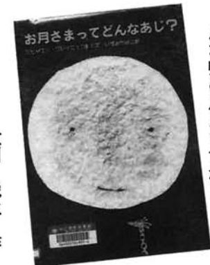
大川悦生 作 梅田俊作 絵