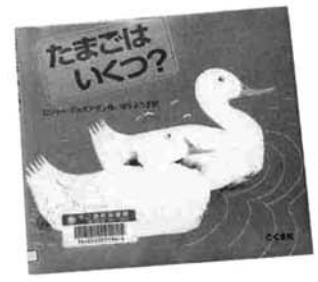
ロジャー・デュボアザン 作 楽しく、かずに出会える本。

たまごはいくつ? 池はこんなに広いのに、あなたとわたしだけではさびしいわ。家族がふえたら楽しいでしょうに。あひるさんはさつそく菓をつくって、ひとつ、またひとつとたまごを生みました。 かずのかぞえ方がお話の中にくまなく織り込まれた、子どもが