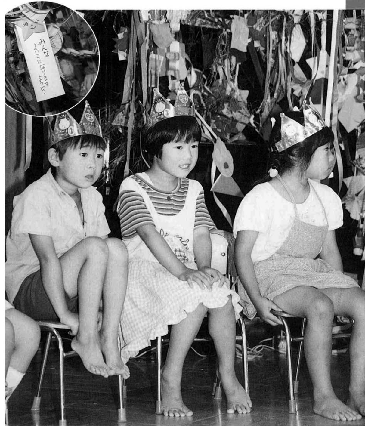
7月4日(木) 上通保育所「たなばたまつり」から