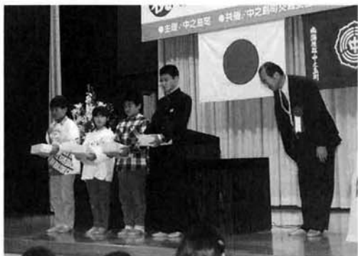
昨年度の交通安全推進大会より