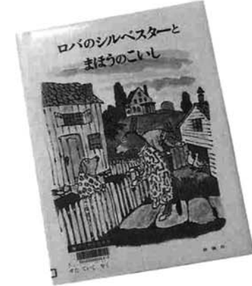
ウィリアム・スタイグ 作

ロバのシルベスターとまほうのこいし ロバのシルベスターは、かわった形や色の小石を集めるのが大好き。ある夏休み、偶然にも願いをかなえてくれる赤い小石を見つけたシルベスターは、帰り道でライオンに出くわし、とっさに岩になりたいと願ったばかりに…… 登場人物の喜び、悲しみを表情豊かに描いています。