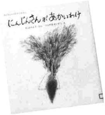
松谷みよ子 文 ひらやまえいぞう 絵

にんじんさんがあかいわけ むかしむかし、だいこんさんが畑でくうくううって寝てるとね、にんじんさんとごぼうさんがお風呂に行こうってさそいに来たの。タオルをさげてでかけるとね…… とっても有名なお話です。語り言葉がなんともステキ。