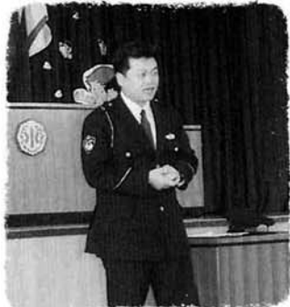
中之島中央小学校