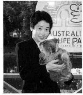
コアラパークにて

次の日は飛行機でブリスベーンへ移動し、ゴールドコーストで後半の二泊をのんびりと過ごしました。これからの大正琴のあり方、レッスンのやり方などいろいろと考えさせられました。他流派と違い、年月も浅いためにいろいろと大変ですが、家元の言われる「心と技」の心にウエイトを置きながら生徒さんと楽しくレッスンをすすめる中で、私自身ももっと技をみが