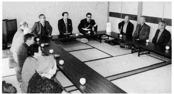
中集新田老人クラブミニ集会から

また、今年度は毎月四日、十日の一週間を「シートベルト着用強調週間」として設定し、着用徹底の気運をより一層醸成していくという取り組みも併せて実施されます。自動車乗車中の交通事故死者の多くはシートベルト非着用であり、着用していれば相当数が助かったとされていることから、「万一のとときの命綱」であるシートベルトの着用の習慣化を推進していくものです。