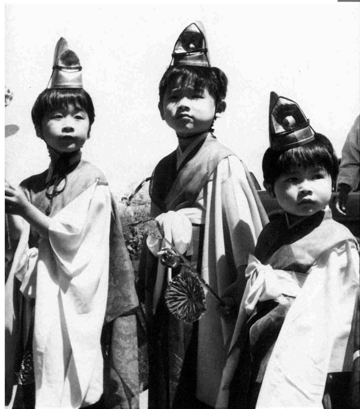
5月5日(祝) 第89回 戦没者追弔法会から