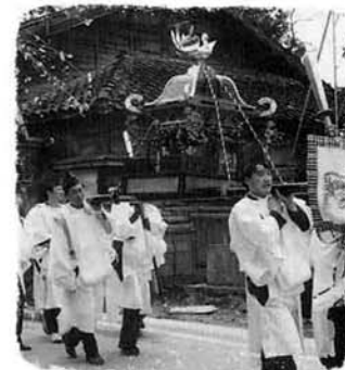
おみこし行列には中条保育所の子どもたちも加わりました