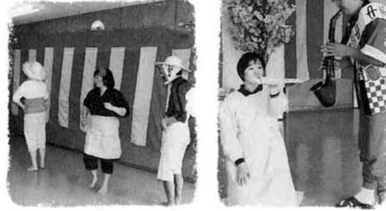
職員の熱演に拍手喝采

四月十七日（月）～二十一日（金）にサンパルコなかのしまでお花見会が催されました。今年も榊トリア仏壇のご厚意により、機能訓練室いっぱい造花の桜が咲き誇る中、職員による踊りやカラオケなどでお花見気分を十分に満喫できたことでしょう。