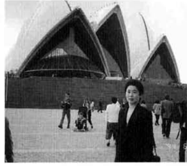
オペラハウスの前で

成田を夜の9時頃出發して、約9時間の飛行でシドニーに着きました。時差は一時間だけです。着いてすぐに市内観光となりました。あの有名なオペラハウスの劇場から成っているこのこ