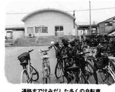
通路まではみだした多くの自転車