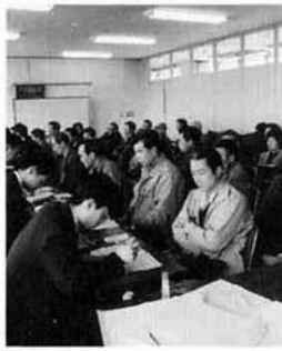
今年の納税相談のようす

受験案内・受験申込書の請求及び問い合わせ先 新潟県人事委員会事務局任用係 [〒950 新潟市新光町4-1 (県庁16階) ☎025-285-5511 内線 3584~5] ※ テレホンサービスによる採用案内もご利用ください ☎025-285-0330 <夜間、休日可>