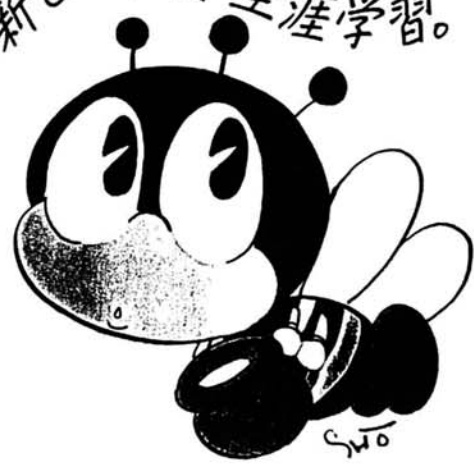
デザイン:石ノ森 徹太郎 生涯学習のマスコット「マナビ」