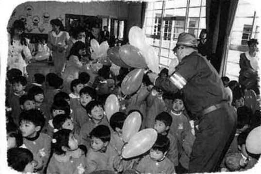
保育所の入所式に訪問した交通安全パレード隊

生や来賓の方のお祝いのことはの はしばし、「あいさつがしっか りできるように」交通事故に気 をつけて」とできてきました。す ると、新入学の子ともたちは 「ハイノ」と元気な声で返事をし ました。 また、中之島保育所の入所式 では、四月六日から始まった 「春の全国交通安全運動」の交通 安全パレード隊が訪問しました。 子どもたちと一緒にお母さん 方にも集まってもらい、見附警 察署のおまわりさんからお話が ありました。 「去年は幸いにも、子どもの 大きな交通事故はありませんで した。これからも車に気をつけ て、飛び出しなどしないよう に」という呼びかけに、子ども たちは真剣なまなざしで聞いて いました。 そのあとごほうびに、風船と クレヨンがみんなに配られまし た。 ちなみに今年の新生生の数は 保育所一二五名、小学校一七七 名、中学校一八四名です。