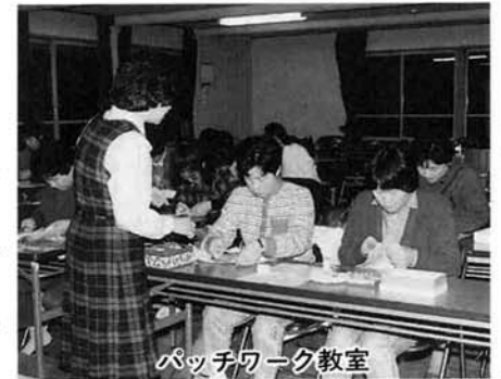
パッチワーク教室

また、パッチワークでは講師をやっています。なかなか手芸を家でやろうと思っ方は少ないですが、一緒にしゃべりしたり、教える人がいたりすると、みんな熱心に作り、できあがった作品は、一月の町民祭に出品したんです。ただ二回しか教室がなかったのが、オリジナルの作品まで手が回らなかったようです。