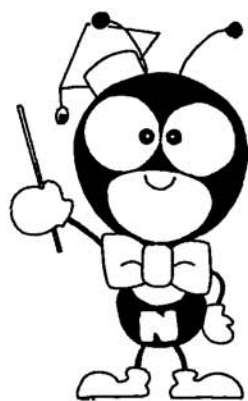
国民年金のマスコット 「ゆめありくん」

うご注意ください。なお、保険料納付が困難な場合は、忘れずに保険料の免除の申請をしてください。 また、一般の場合と同様に免除期間についての年金額はすでに減額されますので、卒業後、社会人となって余裕ができたときは、早めに保険料を追納するようにしましょう。 免除についての手続きや相談は、五月三十一日までに町住民福祉課へお願いいたします。