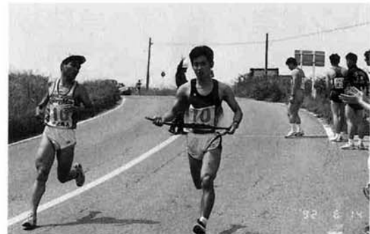
駅伝大会で活躍する中之島チーム(写真は昨年のももの)

毎年六月の第一日曜日は、新潟県を記念して「県民スポーツの日」と定められており、今年六月六日になります。三上市、加茂市、見附市、栃尾市、及び南蒲原郡の各プロックでは、この日を記念し、次のとおり各種大会を開催します。あなたも参加してみませんか? 参加申込等の詳細は、町生涯学習推進課(☎六六―三二四二)までお問い合わせください。