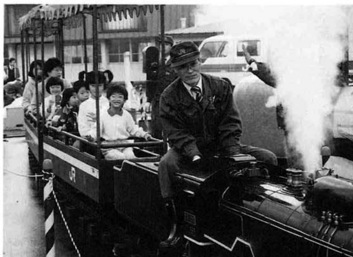
子供たちに大人気！ミニSL