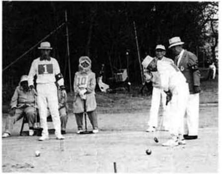
双葉バイレイツ △三位 上通 コエーズ・中之島町役場