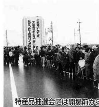
特産品抽選会には開場前から