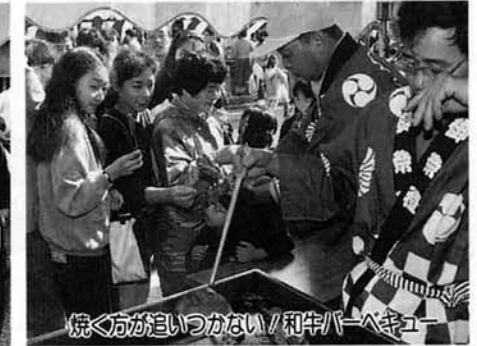
焼く方が見つからない！和牛バーベキュー