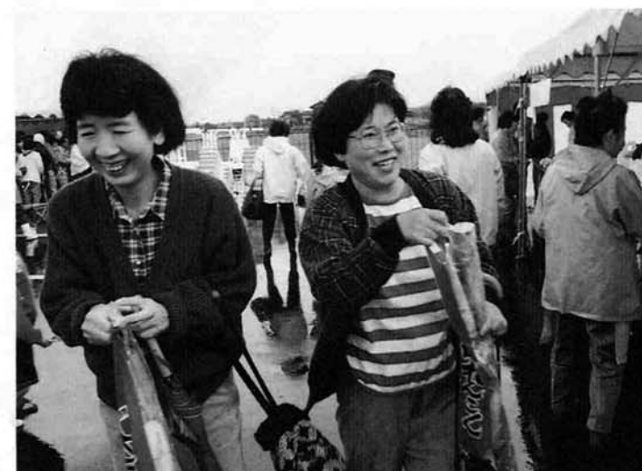
ホラッ レンコン当たっちゃった！ にこにこ顔のお二人さん