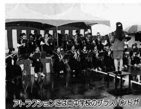
アトラクションには両中学校のブラスバンドが

ジャンボおにぎり、特産品抽選会、キャラクターショー、ちびっこ広場、様々な模擬店等々いずれも大賑わい。皆さん、中之島の収穫の秋を堪能していました。