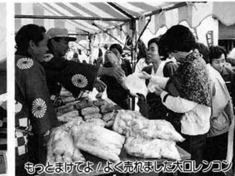
もつとまけてよ！よく売れました大回レンコン