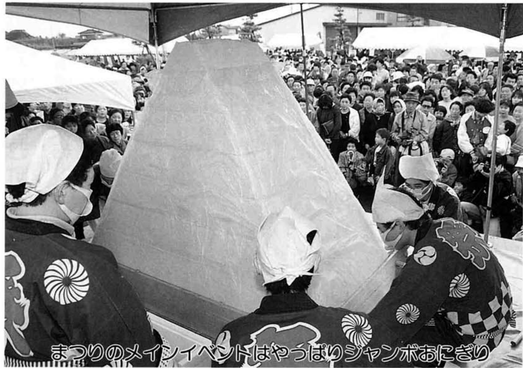
まつりのメインイベントはやうぱりジャンボおにぎり