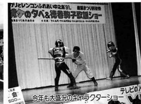
今年も大盛況のキャラクターショー