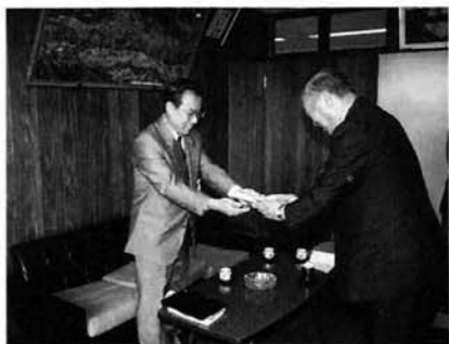
目録を手渡される東北電力 見附営業所長