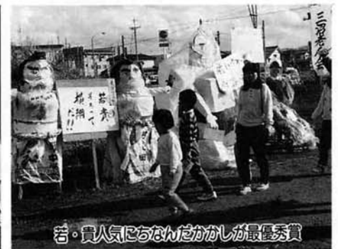
若・貴人気にちなんだかがしが最優秀賞