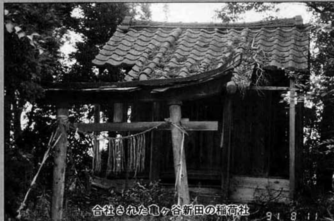
合社された鶴ヶ谷新田の稲荷社

特に、町の特産品でもある大口レンコンは、夏の低温と日照不足で生育が阻害されたうえに台風で茎がなぎ倒されるなど昭和55年以来の不作が心配されています。また、ネギや里芋なども被害を受けたほか、樹木や家屋にも数多くの損傷を与えました。