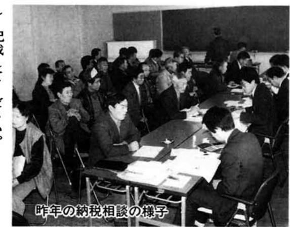
昨年の納税相談の様子

入居した年から5年間、特別控除が受けられます。 本人が住むために、床面積が四十平方メートル以上の住宅を新築したり、購入したり、または中古住宅を購入(建築後