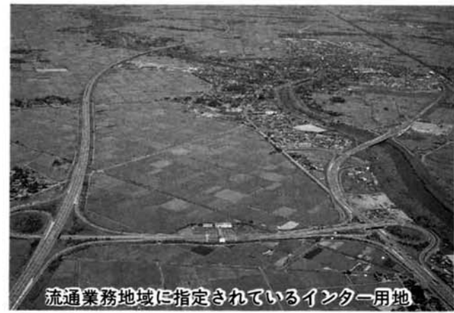
流通業務地域に指定されているインター用地

次々と住宅団地ができているので、それに関する様々な問題も出てきているわけですが、質問にありましたゴミ収集所、防災関係施設、防犯灯等の設置を開発業者に義務づけることもできるわけですが現在はそのままでやっております。また、ゴミ収集所などは地域の自治の中で考えていただくことが基本であろうと考えていますが、これらの諸問題については町と相談していただきながら対応を図っていきたくと考えています。