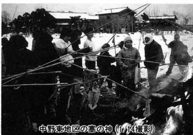
中野東地区の塞の神(1/14撮影)