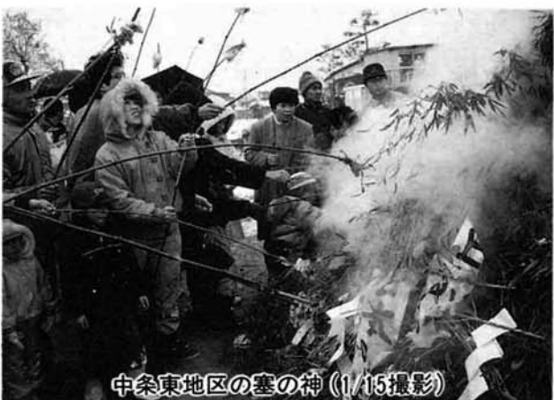
中条東地区の塞の神(1/15撮影)

1月14、15日、小正月の伝統行事である塞の神が、町内各地で行われました。正月らしく雪化粧をした広場では、用意されたお酒やあま酒が振舞われ、燃えさかる炎に大人も子供もスルメやモチをかざし、家内安全や無病息災を祈りました。