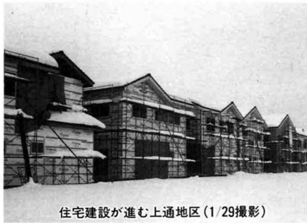
住宅建設が進む上通地区(1/29撮影)

が、現在のところ今後とも積極的に企業誘致を図っていきたくと考えています。中之島工業団地が完売しましたので、今後はインターチェンジ周辺の流通業務地域の開発を検討しています。