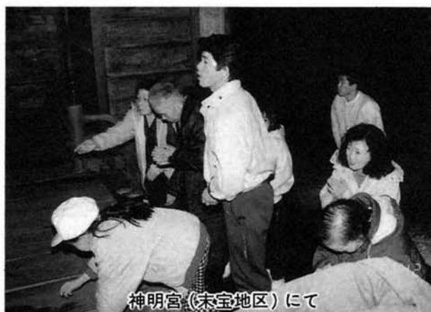
神明宮(宋宝地区)にて

いくら文明が進歩し、便利な世の中になったとはいえ、やはり大晦日や正月は、なんとなく敬けんな気持ちになるものです。町内各地の神社では、今年も大晦日から元旦にかけて、善男善女の皆さんが二年参りや初もうでに数多く参拝していました。