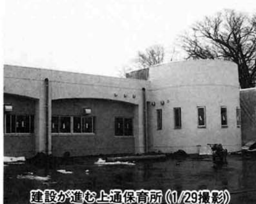
建設が進む上通保育所 (1/29撮影)

上通保育所を新築したわけですが、すでに定員いっぱいのお応募があった。今後の宅地造成を考えると現在の九十人の定員では足りないと思えますが、今後定員オーバーした場合、どのように対応されるのかお伺いしたい。(池