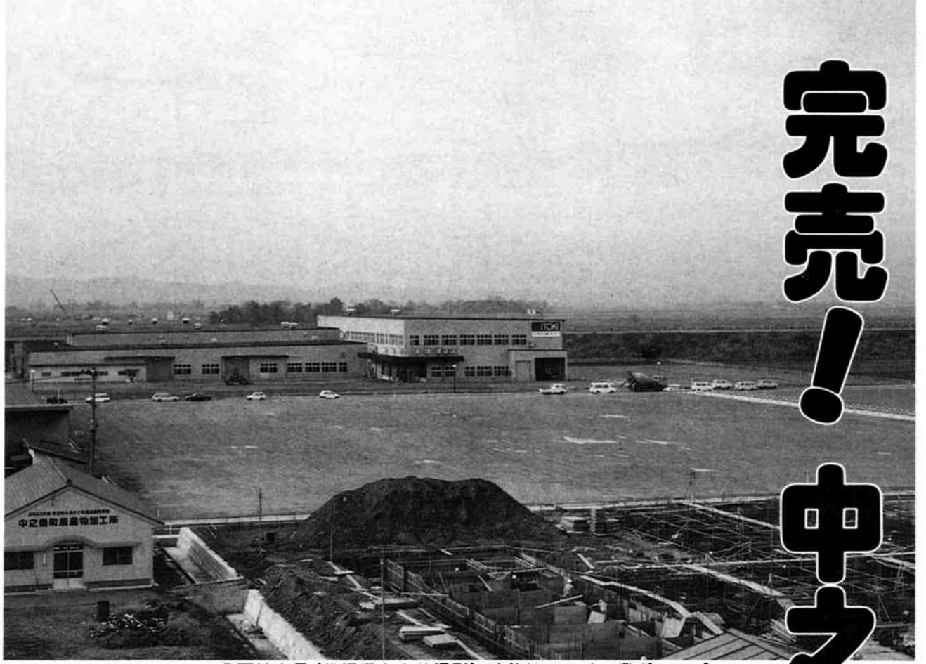
工業団地全景(役場屋上より撮影) 建物はマルイ工業グループ