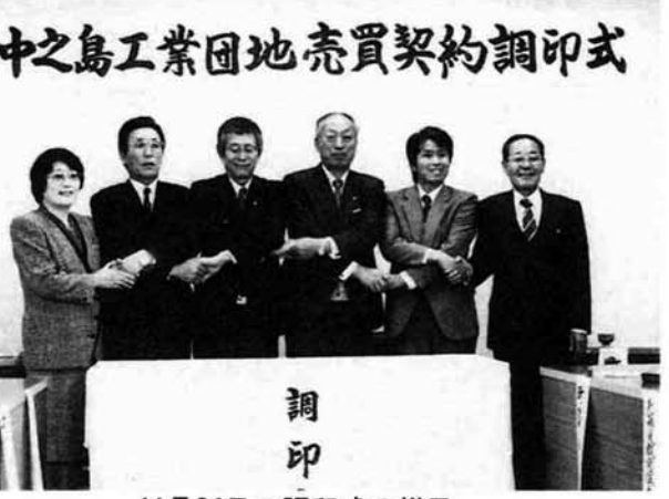
11月24日の調印式の様子