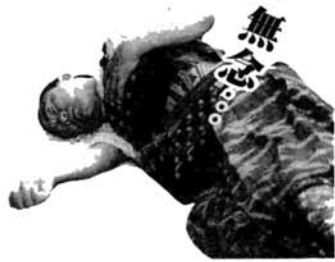
▲暑さで打ち死にした隊士（休憩場所）

「武者行列は、長岡まつりは自分たちのまつりなんだということと、今年が戊辰百二十年ということで参加しました。宮本地区の全戸にチラシを配り、大横、関原、青葉台の人にも参加を呼びかけました。手探りで始めたんですが、たくさんの方が支援をしてくれて、感激しました。でも、行列はさすがに疲れましたね。なにしろ、あの炎天下に十数キロも歩いていったんですから」（同）