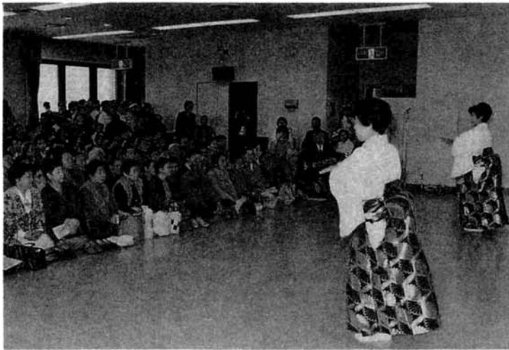
▼地域サークルの芸能発表会 (千手地区のコミュニティセンターにて)