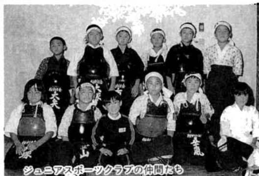
ジュニアスポーツクラブの仲間たち

★ 小学4年以上 参加料 小・中学生 1,500円 高校生以上 2,000円 初回徴収 申込み 11月17日(土)まで