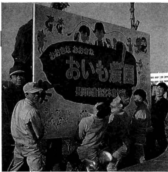
▲看板を立てて、おいも農園の準備完了

雪まつりの次は、長岡まつりです。宮本からはるるる武者姿でやってきて、大手通りをうめた観客をびつくりさせました。「ファイナーレといえば、さいの神をしましたが、その火は宮本神社で点火して、たいまつりレーで会場まで運びました。リレー走者は、高校受験の合格祈願も兼ねた青葉台中学の三年生。ところが、当日はものすごい地吹雪で、後日、風邪をひくものもいて慌てましたよ」（同）