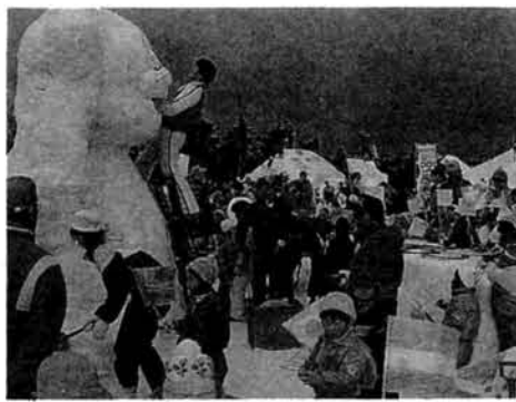
▲百だるま大会(春を呼ぶ雪まつり)

春になって請求書をやると、「こんげんたあけえがなあ」(笑)なんて言われるんですよ。雪の苦しさは、消えたと忘れてしまふんですね。雪のために