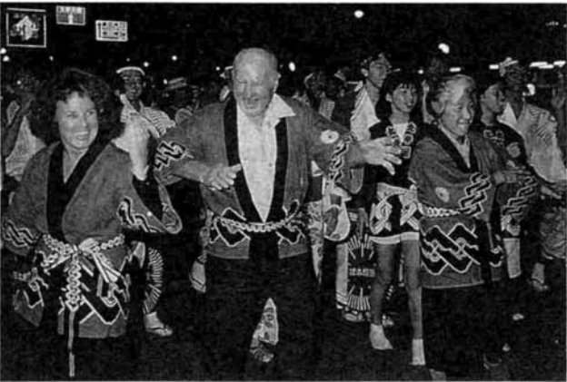
▶長岡まつりに飛び入りのフォートワースのみなさん