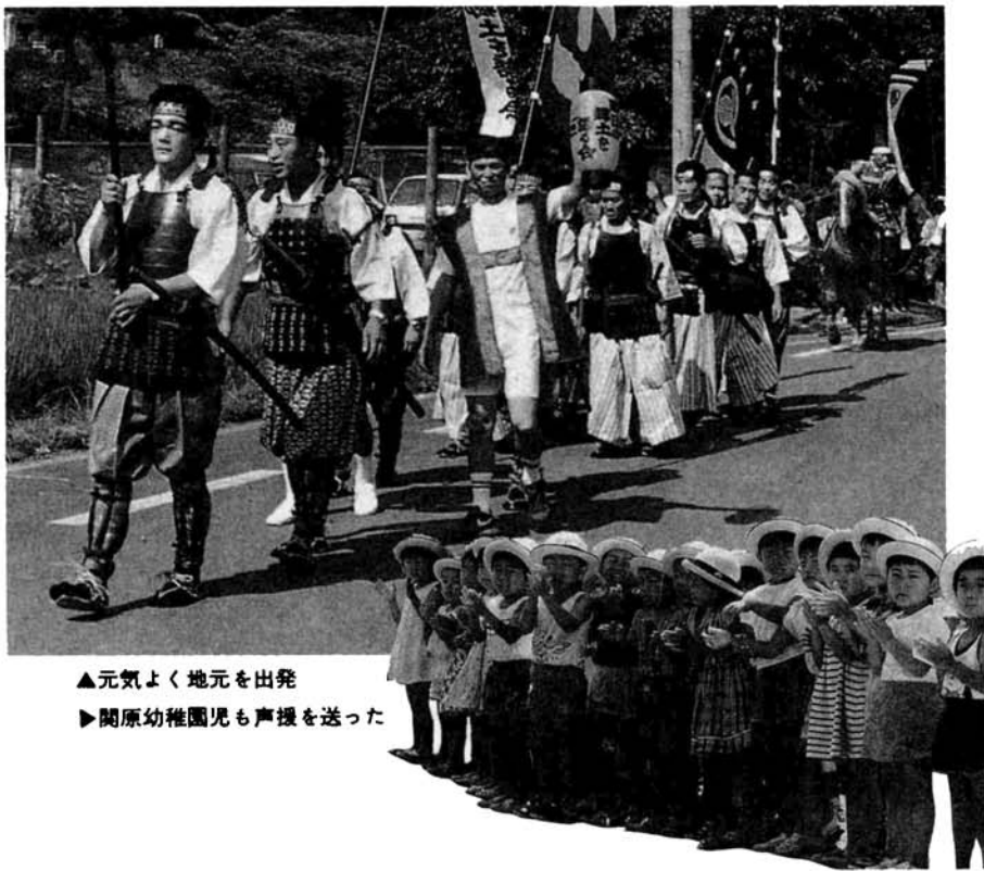
▲元気よく地元を出発 ▶関原幼稚園児も声援を送った