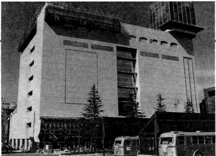
▲再開発ビルは、1階部分の壁面後退により歩道を拡幅したり、駅前広場の地下通路とビル入口を直結するなど、市街地再開発の利点を生かして駅前広場と一体の設計がされている

また、レーザー技術の普及を図るために、県、市、長岡商工会議所、長岡テクノポリス開発機構、県電子機械工業会でレーザー技術振興協議会を設立し、レーザー応用技術研修会を開催するなど、積極的な対応を進めています。