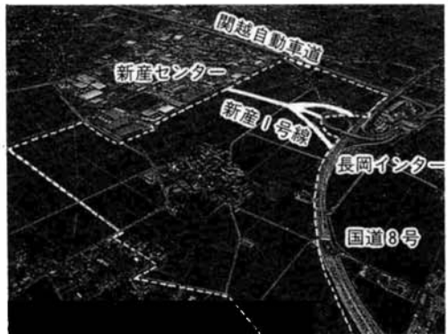
▶長岡インター、国道8号と新産センターの間にある事業区域（点線内）

れます。これに併せて長岡市ではインターに直結する都市計画道路新産1号線を建設するものです。予定では来年度にも事業着手の見通しとなっています。