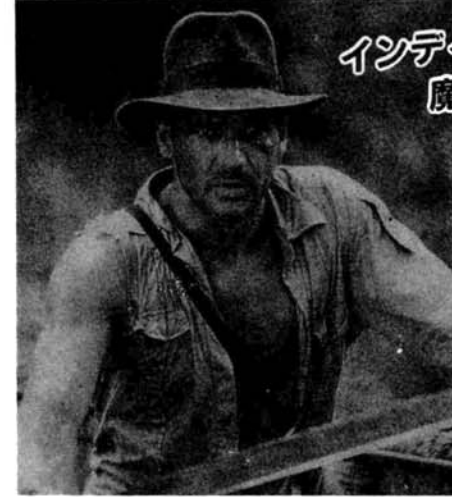
インディ・ジョーンズ 魔宮の伝説 ▲アクション、スリルそして大スペクタクル。冒険活劇のあらゆる要素をふんだんにちりばめた、スティーブン・スピルバーグ監督の傑作映画です。100インチの大画面と迫力あるサウンドでお楽しみください