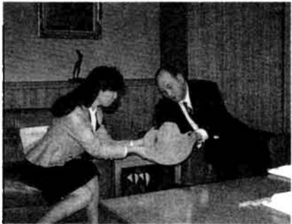
▶インタビュー終了後、フオイトワース市訪問の話を市長から披露された。ふたりが手にするのは、その時のおみやげの品

ために集まっていたら、新長岡発展計画について、昭和六十五年以降の計画をどうするか、検討していただきたいと思っています。