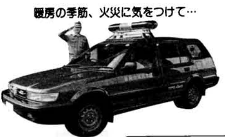
柏ライオンズクラブから寄贈された消防司令車

「信濃川を見つめる写真展」 日時 11月23日(休)~27日(日) 10:00~18:00 会場 長岡市美術センター (中央図書館2階)