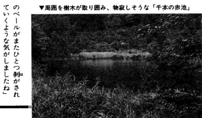
▼周囲を樹木が取り囲み、物寂しそうな「千本の赤池」

千本の赤池を科学する 「千本の奥に、赤池という大きな池があります。この池は伝説があって、池の主は赤牛だとも大蛇だとも伝えられています。農具を投げ込んだりすると