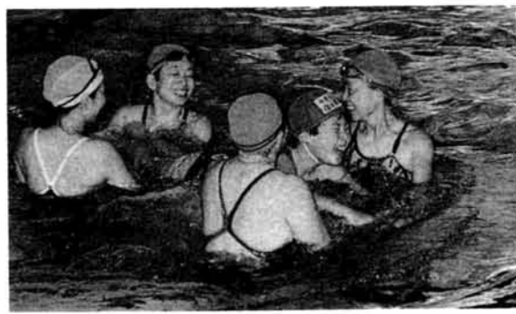
長岡婦人水泳クラブの皆さんは毎週金曜日に心身に障害を持つ子供たちの水泳指導を7年間も続けています。「水泳を通して子供たちが明るくなっていくのがうれしい」と皆さん……

市議会議員は、年賀八ガキを自粛します 私ども長岡市議会議員は、昭和六十四年、年賀八ガキの自粛を申し合わせました。ご理解くださるようお願いいたします。 長岡市議会議員一同