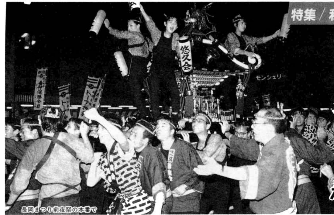
長岡まつり前夜祭の本番で

「悠久会」の活動は盛んで、これまでに「ながおか春を呼ぶ雪まつり」や長岡まつりの武者行列への参加をはじめ、市長との対話集会の開催、緑の少年団の結成など、積極的に動いています。それにしても、「明日の郷土を語る会」のパワーはすごいものがあります。たとえば、雪まつり。雪まつりは、当日もさることながらそれまでの準備が大変でした。メンバーに農協青年部がいますので、減反で