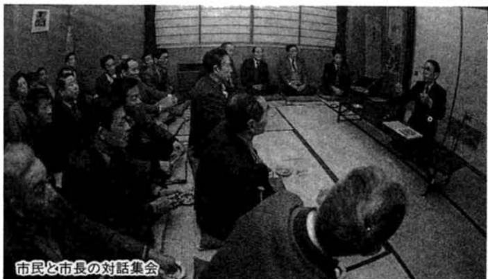
市民と市長の対話集会

長岡まつりはつまらない、という声をとときき耳にします。でも、長岡まつりは若いまつりです。やっそこまで成長してきたのです。そして、自分たちで汗を流し、お金をつかつて、まつりを盛り上げようとしている人がいっぱいいます。わたしたちの長岡まつりの将来に期待してもいいのではないのでしょうか。