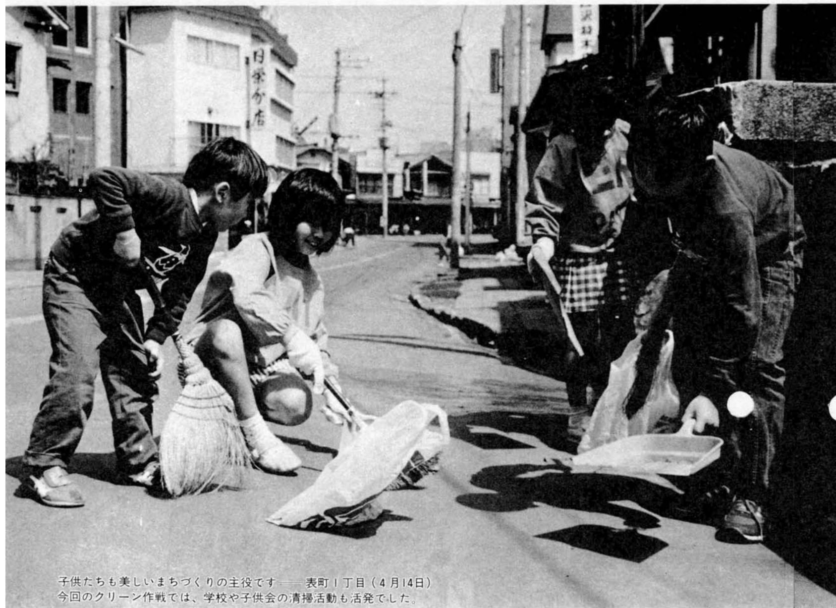
子供たちも美しいまちづくりの主役です——表町1丁目（4月14日） 今回のクリーン作戦では、学校や子供会の清掃活動も活発でした。