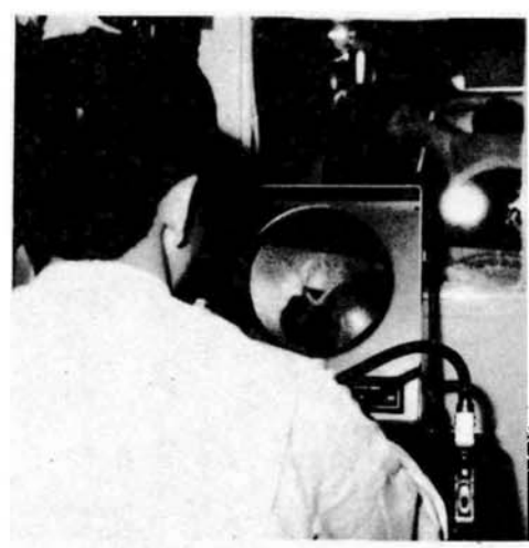
成人病は「早期発見・早期治療」が大切です（胃がん検診）

実行することです。それが健康への自信となり、あなたの健康度を一層高めてくれるはずです。 そしてその後も、やっぱり健康診査。日ごろの健康づくりの成果を確かめ、健康を確認することで、明日からの健康づくりにもまた熱が入ります。 年に一度は健康診査——これが健康法の原点です。