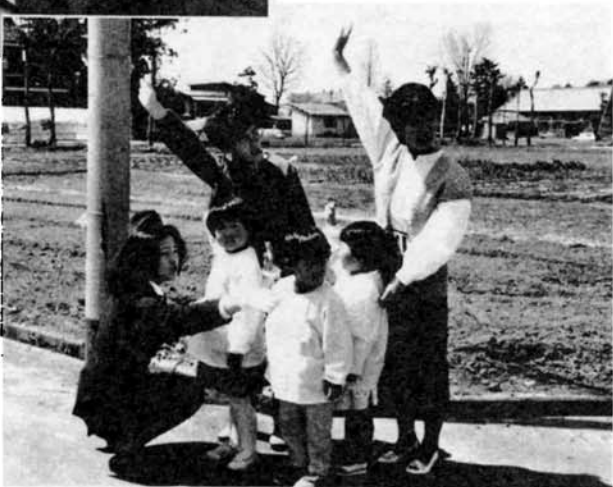
▲保母さんやお母さんも一緒になって 道路の横断練習。(福戸保育所)

▶手づくりの人形劇で交通教室 マンガの主人公が登場すると、子供たちの目は一段と輝きます。楽しみながら交通ルールを覚えてもらおうと、指人形から劇の台本、紙芝居づくりまで、隊員たちはいろいろな工夫を凝らします。(長峰幼稚園)