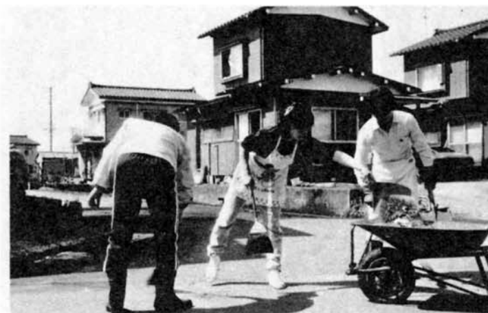
町内一斉清掃も各地域で活発に…。コミュニティづくりにも一役かいました——大町3丁目（4月14日）