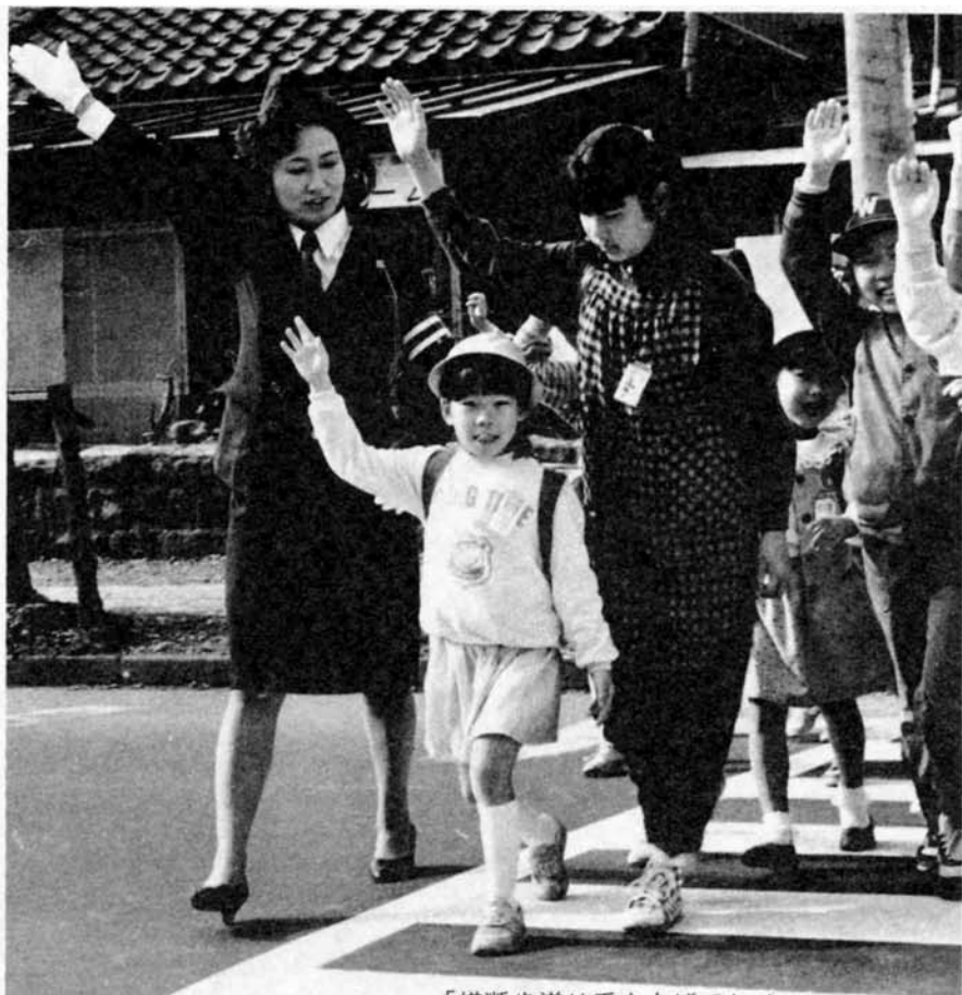
「横断歩道は手を上げてね！」 小学生の登校指導で婦人交通パトロール 隊員の一日が始まります。(阪之上小学校)