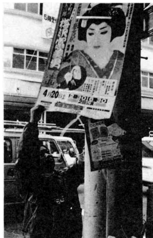
電柱にくくり付けられたポスターや張り紙類も撤去（3月25日）