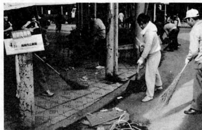
大手通りとすずらん通りを青年会と町内会の皆さんが、一斉清掃。クリーン作戦の口火を切りました。（3月25日）