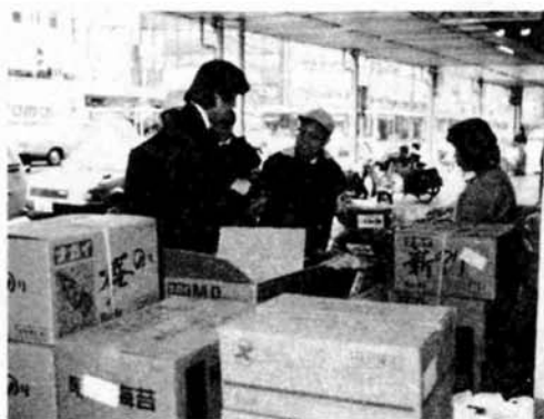
長岡駅や大手通り周辺では、歩道にはみ出した看板や商品などの取締りが行われました。（4月12日）