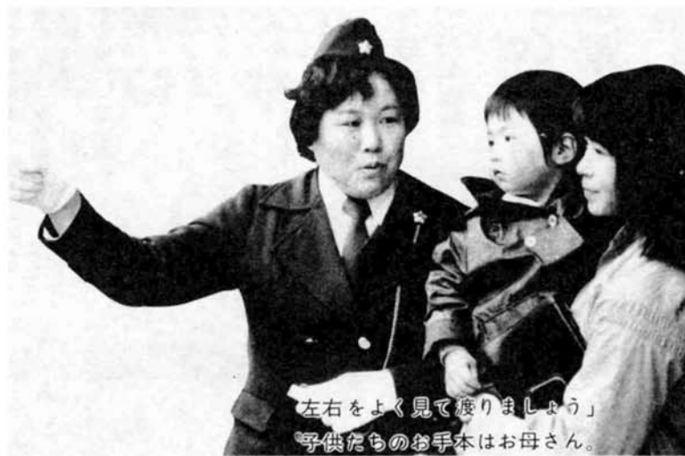
「左右をよく見て渡りましょう」 子供たちのお手本はお母さん。