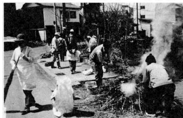
青年会議所150人と柿川沿いの40町内会1,000人の皆さんが、柿川沿岸の美化に取り組みました。（4月14日）