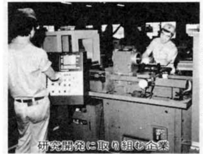
研究開発に取り組む企業

優れた技術力・商品開発力 がありながら資金不足で研究 開発ができない企業に無担保 で債務保証をし、資金面から 技術開発を支援します。 対象 市内に事業所を持ち、 高度な技術開発・研究 開発活動を行っている 企業 保証限度 一企業・一事業当 たり二、〇〇万円以内 保証料 年二% 保証期間 八年以内(据置含 む) 低利融資 この制度を利用す