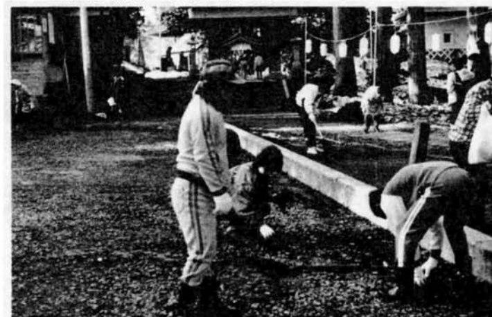
花見シーズンをひかえた悠久山公園では、立正佼正会の皆さん700人が大清掃を行いました。（4月14日）