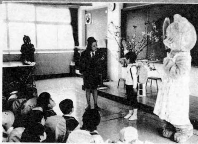
▶下校前の交通教室 人気者のぬいぐるみ を使って、一年生と交通 ルールのおさらいをし ます。(黒条小学校)