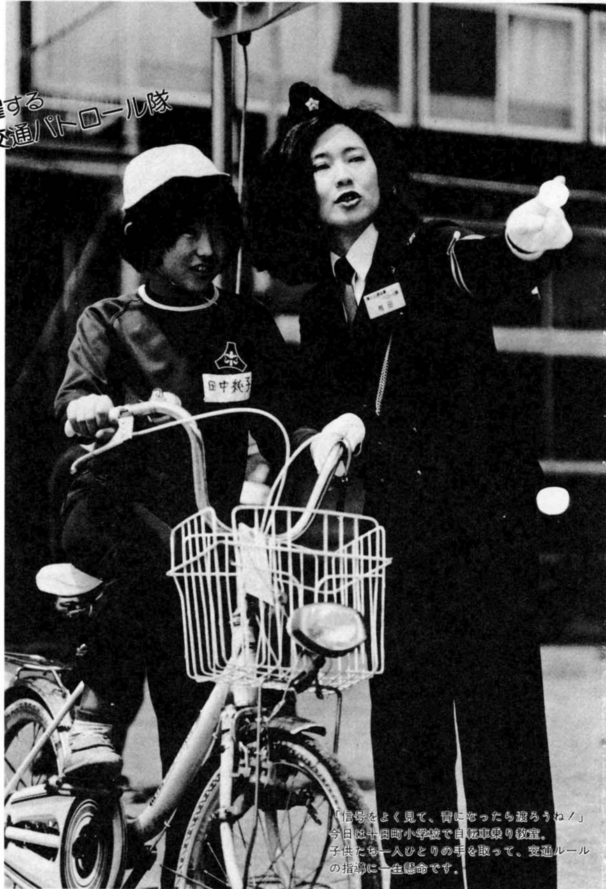
「信号をよく見て、青になったら渡ろうね！」 今日は十日町小学校で自転車乗り教室。 子供たち一人ひとりの手を取って、交通ルールの指導に一生懸命です。