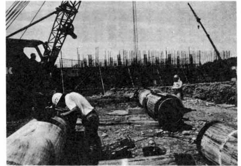
上除町の高台に建設が進められている上除配水池——。大島加圧ポンプ場から送られてきた水は、ここから長岡ニュータウンをはじめ、川西地区全域に配水されます。

とくに、長岡ニュータウン建設が進む川西地区では、いま、大島加圧ポンプ場と上除配水池の建設工事が急ピッチで行われています。