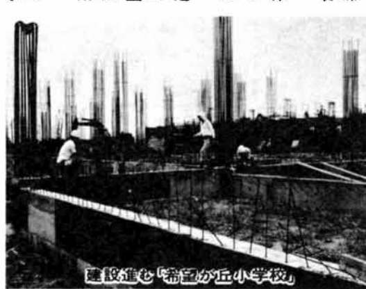
建設進む「希望が丘小学校」

使用料はさしあたり無料で使用ご希望の方は、レクリエーション課(☎三五一一二二)へお申し込みください。なお、残りの二、三〇〇平方メートル(約六、七〇〇坪)は、53、54年度事業で整備します。市内の主なスポーツ、レクリエーション施設は、下段のとおりです。