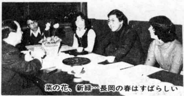
菜の花、新緑...長岡の春はすばらしい

ここ数年、Uターン現象が大きな流れになるなかで、若い人たちは、このふるさと長岡で暮らし、そして真剣に将来をみつめています。 いま、二十一世紀をめざす魅力ある地方中核都市に向って大きく前進している長岡市は、この若い人たちのエネルギーに大きな期待をよせています。 そこで今月は、長岡市に住む若い人たちが、このふるさと長岡をどのように見、どんな街にしようと考えているかを、いろいろ話し合っていたきました。