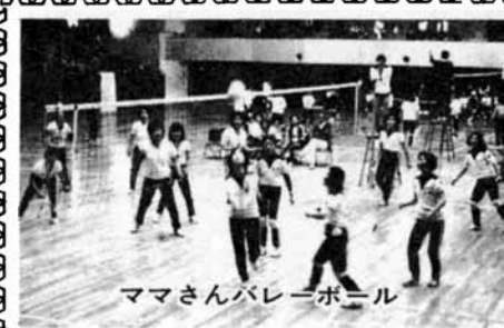
ママさんバレーボール

寒さにめげず バレーボールの練習 「ハイ、返して……」 「ワン、ツウ、スパイク」 これは、今月二十日に開かれる公民館親善婦人バレーボール大会に備えての練習のひとコマです。(写真) ことしは、例年になく大雪でしたが、各公民館のママさんは、学校開放の時間を活用して猛練習中……。 毎年開かれているこのバレーボール大会も、ことしで四回目……。