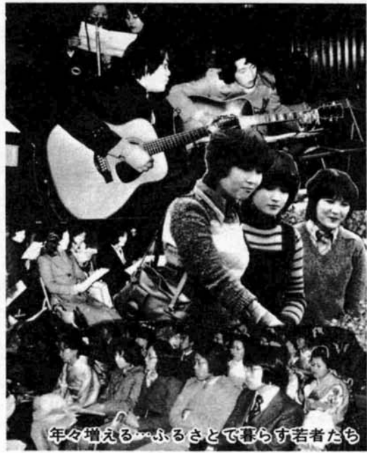
年々増える...ふるさとで暮らす若者たち