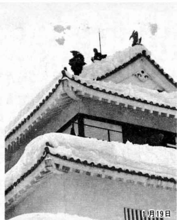
郷土史料館も雪おろし

なお、軽症などで救急車を呼ぶまでもないのに要請を受けて、出動したケースが471件もありました。救急車は正しく利用しましょう。