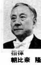
指揮 朝比奈 隆

■前売券 A 指定席1,700円 B 指定席1,300円 C " 500円 ■発売開始 4月20日から市立劇場および市内各プレーガイドで。