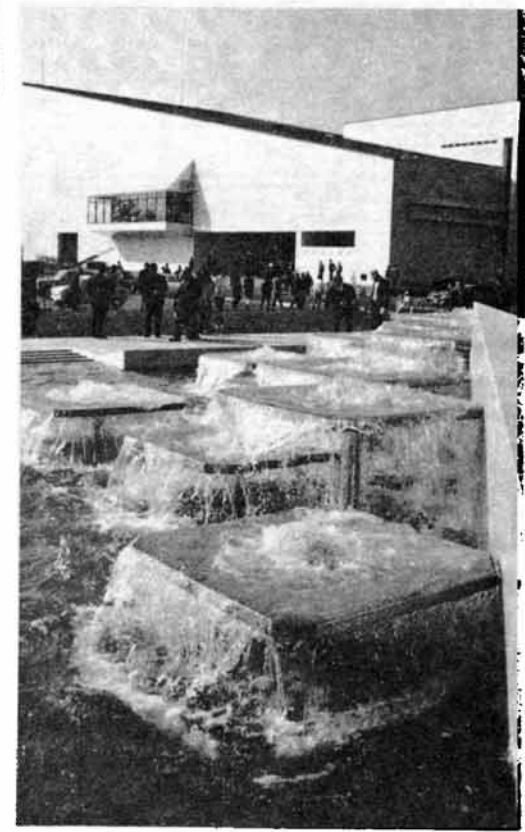
大理石張りのモダンな噴水