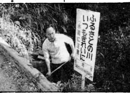
清潔な町づくりを目指す日越地区組織推進協議会は、このしも川をきれいにする運動を進めています。地区の九町内を流れる川の二十四か所に、呼びかけの立札(写真)を立てたり、川の清掃を行なうなど、その活動は大へん意欲的です。

よりよい社会は奉仕の精神から…をモットーに、社会奉仕活動を活発に展開している長岡ロータリークラブは、悠久山公園内にあずまや一か所を作り、このほど市に寄贈しました。同クラブは昨年も悠久山公園にあずまやと水のみ場を贈るなど、公園施設の整備にも積極的な活動をしていきます。