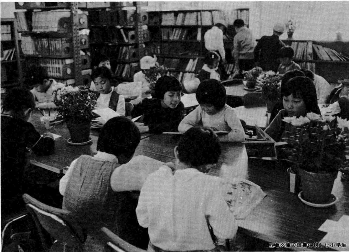
互尊文庫で読書に親しむ小学生