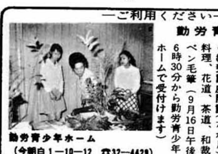
労働青少年ホーム (今朝白1-10-12 32-4428)

○労働学校ご案内 健全な労働関係確立のために、 県では次のとおり開催します。 ○日時：10月17日(火)18日(水) ○会場：中越婦人会館(城内町三) ○対象：労働者、使用者、一般 ○内容：週休二日制の考へ方と実 際、県内の経済情勢、最近の労 働判例、これからの労働組合の あり方。 ○受講料：無料 ○申込：長岡労政事務所(35-34 1-311)へ