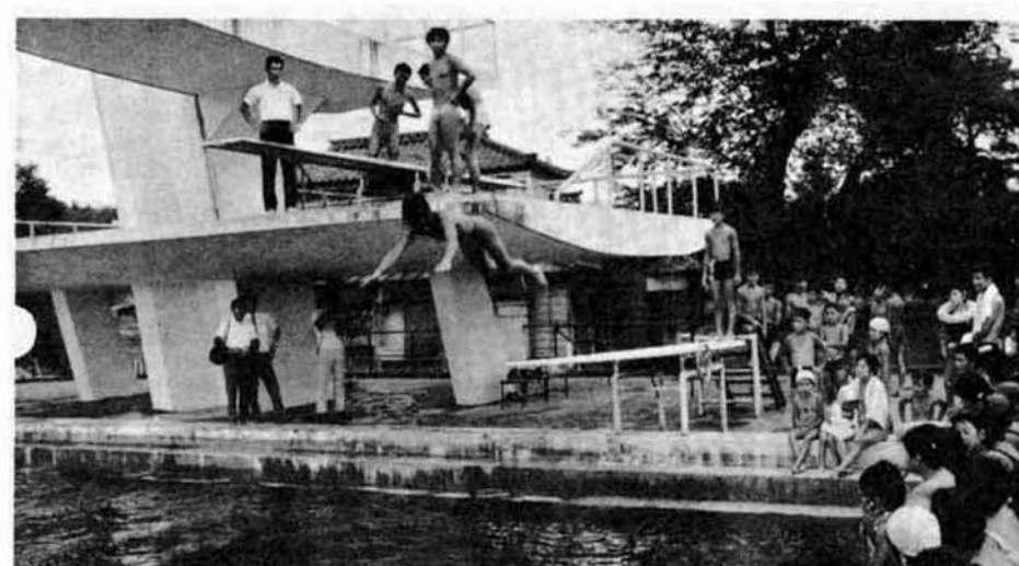
腹からバシャン 水しぶきをあげてドボン——。先月15日から悠久山プール で開かれた「初心者ダイビング教室」には70人もの市民が参 加、涼しさとスリルを楽しみました。おそろおそろ飛び込んでみたもの、腹か らバシャン、尻からドボン。なかなかうまくいきません。