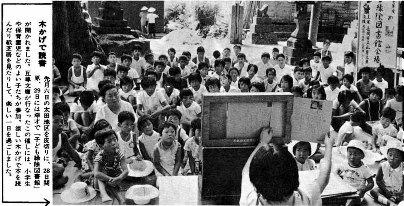
木かけて読書 先月六日の太田地区を皮切りに、28日間 原、29日には深才で「子ども緑陰図書館」 が開かれました。互尊文庫が行なったこの催しには、小学生 や保育園児などのよい子たちが参加。涼しい木かけて本を読 んだり紙芝居を見たりして、楽しい一日を過ごしました。