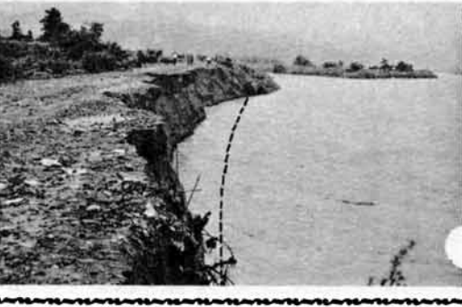
大きく削り取られた旧堤、(点線は欠壊前の堤防)

築いたところですが、ここには昭和二十七年に築いた旧堤もあり、ちようど堤防が二重になっているところ。このたびの危機は、この旧堤が百五十メートルにわたって、三分の二近くも削り取られたもので、もしこれが欠壊した場合、その衝撃がすさまじいエネルギーとなって、いつきよに新堤を襲うことが心配されました。