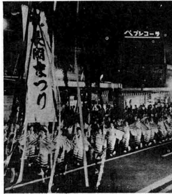
(不夜城を思わせる前夜祭のにぎわい)

事あけは 一日の前夜祭 前夜祭は八月一日の夜、七時三十分から九時四十分まで大手通で開かれますが、まず、第一部の鼓笛・吹奏パレードには、消防音楽隊や市内の小・中・高校生など約一千四百人。第二部の長岡ばやし大会には、町内会・事業所・民謡