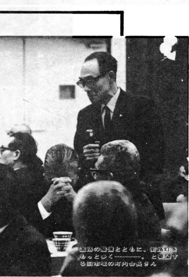
道路の整備とともに、街路灯をもっと多く……と要望する町内会の町内会長さん