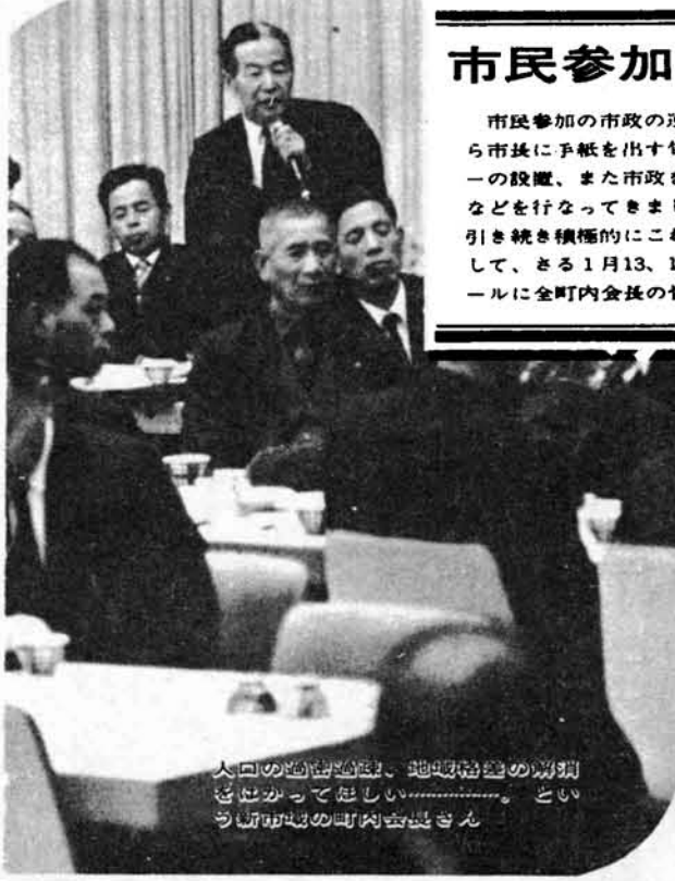
人口の増加に伴い、地域格差の解消をはかってほしい……と、いふ町内会の町内会長さん

き、当面する市政の課題と将来の展望を、ともに考え、ともに話しあっていただきました。今後は市政を語る地域のつどいの開催などに考える市政、話しあう市政の推進にあたりますので、皆さんの積極的な参加をお願いします。(町内会長懇談会の内容は3頁に掲載しました。)