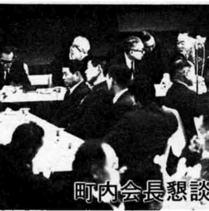
町内会長懇談会から

生活様式の変化にともない、ごみの量は増える一方で、市ではごみ処理を最重点問題として、その対策をはかっています。この懇談会でも十六件の意見・要望がありました。 ●(おもな意見・要望) ●新市域もごみ収集を…… ●危険物収集をせめて月一回に……ごみと危険物の区別するように市民の啓蒙を…… ●(おもな意見・要望) ●下水対策を強力に…… ●現在ごみ収集は、旧市域を中心に行ない、新市域はこれまで一回だった危険物収集を、昨年からは六回に増やして、皆さんのご要望に近づこうと努力されています。またこれだけでなく将来新市域もごみ収集を行なうよう検討しています。