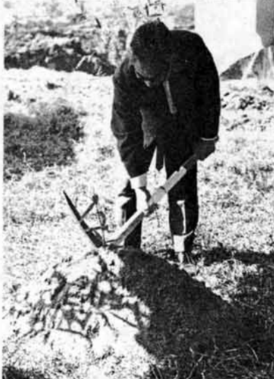
写真上 工事の始まった新浄水場 下 起工式で歎入れする市長