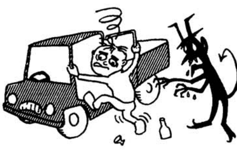
恐ろしい酒のみ運転