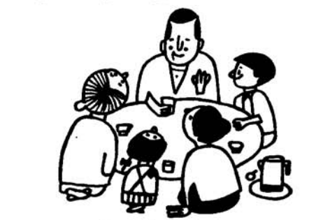
みんなで楽しい家庭