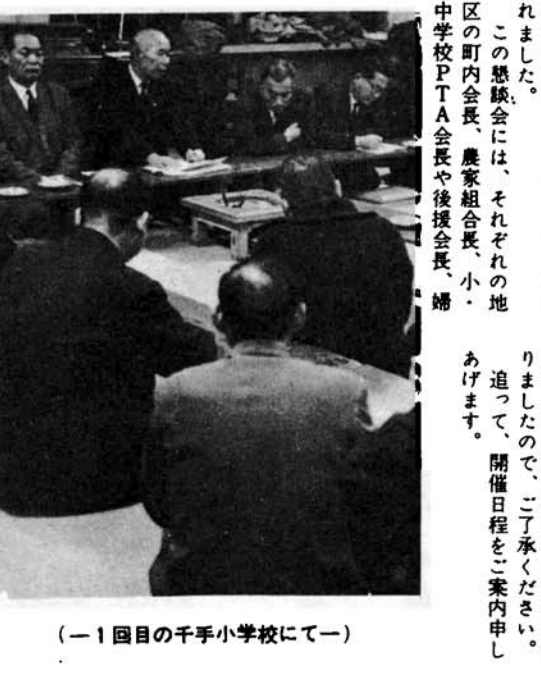
(一 一回目の千手小学校にて一)

市政の発展とよりよい市民生活の向上をはかるために、市民の皆さんに市政の方針を知っていただく、また皆さんからは建設的な意見や要望を聞く「市政懇談会」が、さき十一月二十二日から十二月六日まで、市内十一の会場で開かれました。 この懇談会には、それぞれの地区の町内会長、農家組合長、小中学校PTA会長や後援会長、婦 人団体長、商工団体長、農協組合長、土地改良区理事、公民館分館長の方々のご参集を得て、市側からは市長、助役、関係部長、それに、関係市議会議員が参加して話し合われたわけです。 そして、各会場とも、市長から市政の現状と今後の施策について説明があった後、参加者から、市政に対する意見や要望が述べられました。話し合いの内容は、今後の市政施策の資料とされます。 なお、全地域を巡回して開催する予定でしたが、十二月定例市議会との関係で延期することになりましたので、ご了承ください。 追って、開催日程をご案内申し上げます。