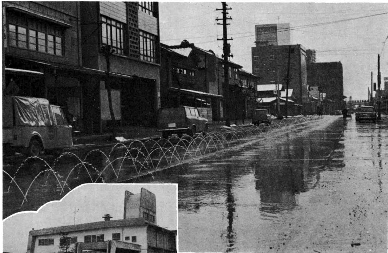
(年々延長される消雪道路一城内町通りにて一)