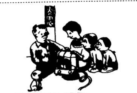
暖房器具の正しい取扱い

年末年始のごみ収集にご協力ください きたる十二月三十一日から一月四日までの五日間、市内のごみ収集を休ませていただきます。そのため、一月五日以降は、ごみ収集車を総動員して収集にあたりますので、ごみ収集の休み期間中のごみは、雨や雪にぬらさないように袋や俵に入れて保管しておきましょう。ごみを多く出される事業所では、直接、焼却場に運んでいただくなどして、川やあき地にごみを捨てないようご協力を、切にお願いたします。