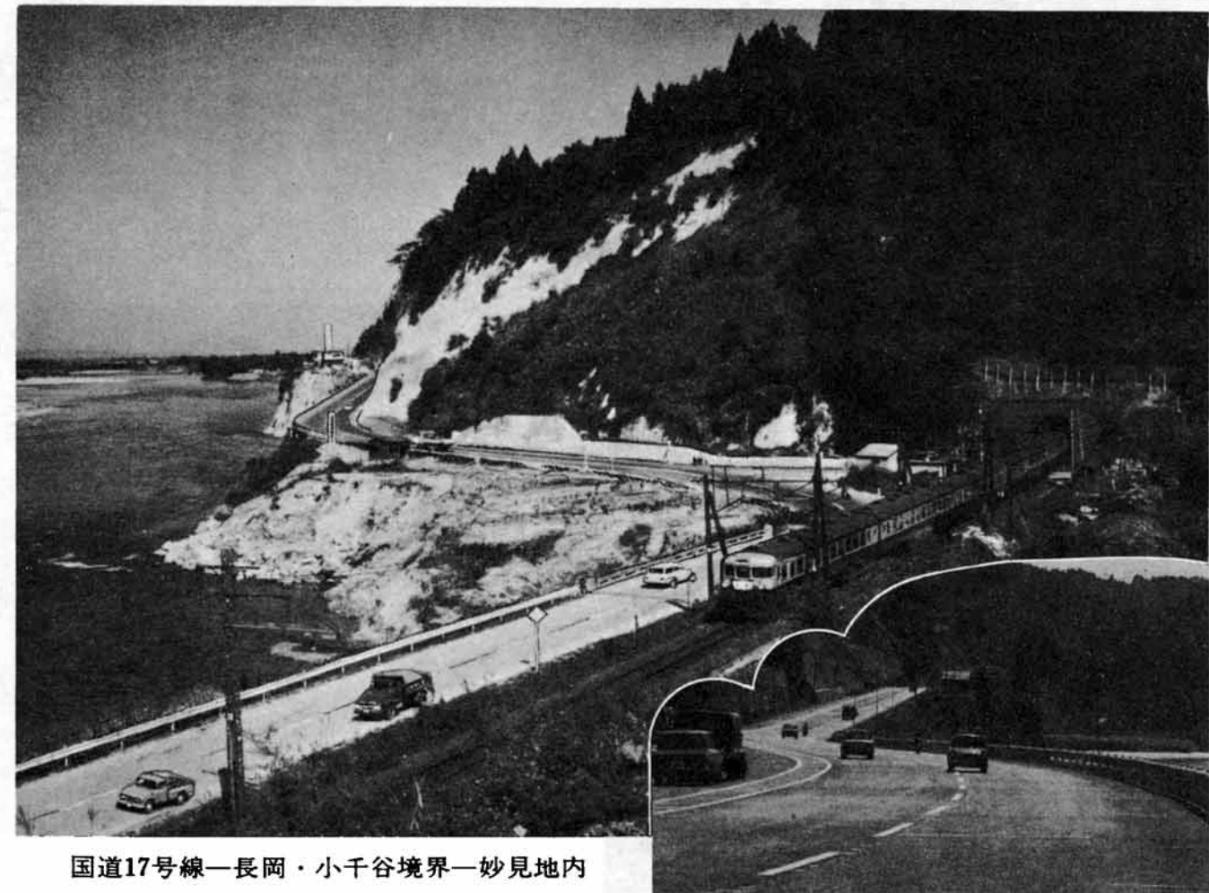
国道17号線—長岡・小千谷境界—妙見地内