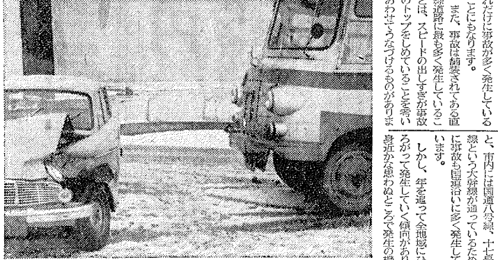
日付不明の交通事故現場。被害車は左側に倒壊し、運転手が軽傷を負った。事故原因は速度の出しすぎと見られる。

交通事故は全地域で発生していることがわかった。特に、市街地や主要道路で事故が多発している。これは、交通量の増加と、ドライバーの速度の出しすぎが原因とされている。 また、昨年の交通事故は、全体的に減少傾向にあるが、舗装道路に事故が多発していることが注目されている。これは、舗装道路の交通量の増加と、ドライバーの速度の出しすぎが原因とされている。