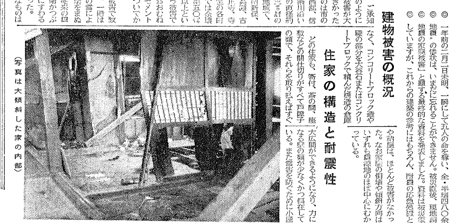
写真は大地震した家の内部

建設被害の概況 ① 罹災地区は、一帯にわたる。被災地区は、概ね、長岡市、佐和田町、上野原町、小針町の各町界を以て、北にわたる。被災地区の面積は、約一、〇〇〇ヘクタールに達する。被災地区の人口は、約一、〇〇〇人である。被災地区の家屋数は、約一、〇〇〇棟である。被災地区の家屋の被害状況は、大半が耐震上に欠点である。被災地区の家屋の被害状況は、大半が耐震上に欠点である。 住家の構造と耐震性 ② 罹災地区の家屋の構造は、大半が木造である。被災地区の家屋の構造は、大半が木造である。被災地区の家屋の構造は、大半が木造である。被災地区の家屋の構造は、大半が木造である。 建築物被害の概況 ③ 罹災地区の建築物の被害状況は、大半が耐震上に欠点である。被災地区の建築物の被害状況は、大半が耐震上に欠点である。被災地区の建築物の被害状況は、大半が耐震上に欠点である。