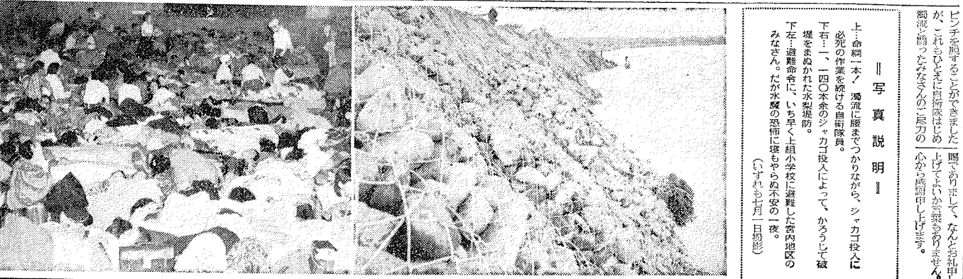
命綱一本! 濁流にさらされ、命を失った。●市の生命財産を守りついでに、濁流と死闘を繰り返して、ついに水魔攻防戦に凱歌を奏した。

しかし、出動した自衛隊員は、濁流の激流に押し流され、命を失った。●市の生命財産を守りついでに、濁流と死闘を繰り返して、ついに水魔攻防戦に凱歌を奏した。