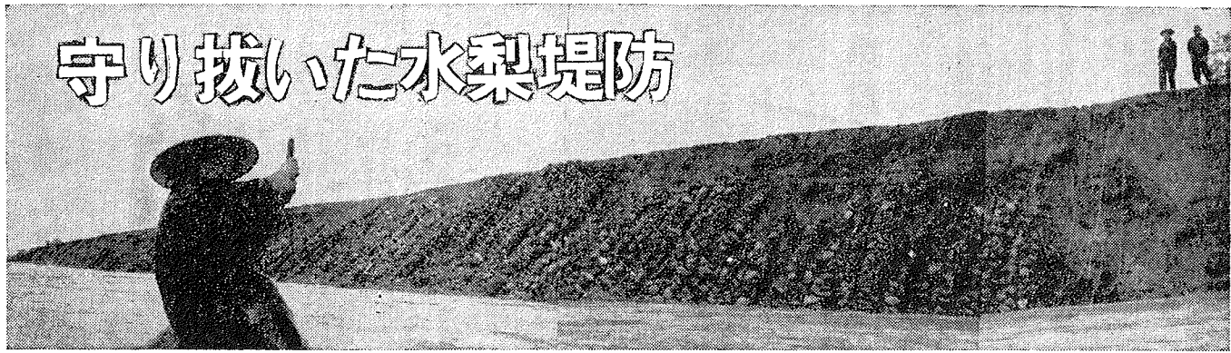
蛇カゴで支えた450軒