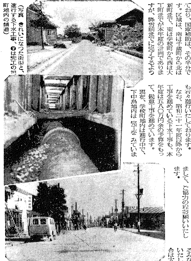
(写真) きれいな街並と、進行する下水工事、(右)は完工の町内への補道

本年も、昨年引続き戦災復興事業として街集事を行ってまいりました。この事業費は約二千万円となっており、国庫補助はその半分で、区は、両は千歳町から北は新町まで、東は学校町から西は大町までが本年度の計画であり、また、降雪前までに完了するよう現在、学校町内は進行中で、下中島内は完了をみています。