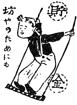
坊やりのためにも

国民の一人一人の力で...それは一人一人の力が小さいかも知れませんが、まとまると次のようになんか大きな力になります。