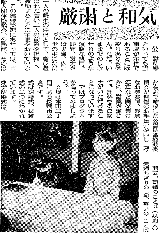
式場、司婚のことは(嫁附人)夫婦きりの重、重いのことは

新生活運動は別にむづかしいものではありません。自分でまず考えること、みんなと話し合うこと、そして力を合せて身近なことから実行していくことです。