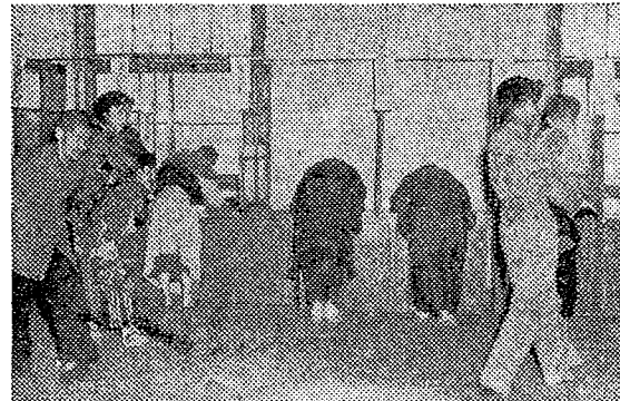
【写真は市議選投票所の二コマ市役所にて】

有権者数 男 三四、一一三 女 三八、一八四 計 七二、二九七 票者数 男 三二、六六一 女 三四、四四八 計 六六、一一九