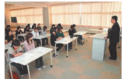
▲参加した保護者からは「勉強になります」「子育ての心配ごとは、学校や教育委員会に相談するというお話に、安心。心強いです」という声が聞かれました。

夜 早く寝る子どもほど、学校が楽しいと感じています。就学時等家庭教育講座では早寝・早起きやお手伝いといった、生活習慣を小さいうちに身に付けておくことの大切さを中心にお話しています。