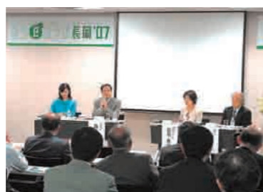
▲企業進出のメリットを全国に発信したフォーラム・みらeコラボ

●全国の企業への誘致も促進。フォーラム開催 十月四日には、東京・秋葉原でフォーラム「みらeコラボ長岡'07」を開催。首都圏の建設業や製造業など約百五十人が参加し、「この土地の持つポテンシャルは高い」「進出を考えた魅力的な場所」など高い評価が聞かれました。