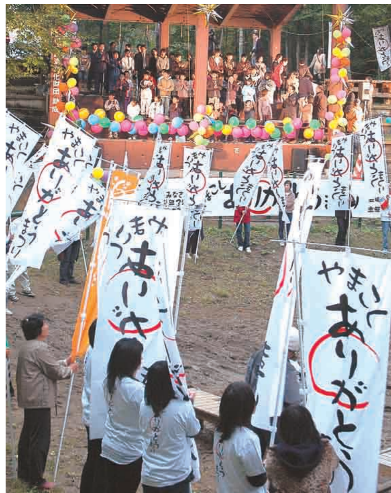
感謝 山古志小・中学校の児童と住民たちが、全国から寄せられた支援に感謝の思いを込めて作った歌「ありがとう」を大合唱（山古志闘牛場・10/21）