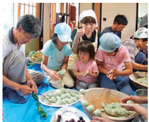
▲地域の郷土食「ちまぎ」づくりのイベント。集落内外から幅広い世代が参加（6月23日）

森光集落は世帯数六十二戸、人口約二百人。「農業の衰退がふるさとの衰退につながる」との危機感から、平成六年に森光担い手生産組合を設立。平成十年に法人化しました。生産組合、老人会、婦