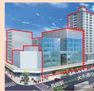
◀大手通中央地区の完成予想図 ■が東地区、■が西地区