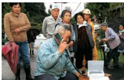
▲衛星携帯電話の通信訓練（10月21日 小国地域八王子集落）

今回新たに衛星携帯電話三十七台を配備しました。通信可能範囲が広く、地上設備が故障してほかの通信手段が使えないときにも通話できることが衛星携帯電話の強みです。災害時に孤立することが懸念される中山間地を中心に配備しました。