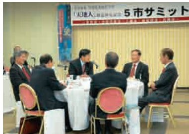
▲5市サミットで交流を深めました

平成二十一年のNHK大河ドラマに直江兼続が主人公の「天地人」が決定したことを受け、十月十九日、直江兼続ゆかりの五市によるサミットを長岡で開催しました。長岡市、上越市、南魚沼市、福島県津若松市、山形県米沢市の市長たちが、五市で連携して観光ルートを検討する