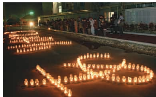
祈り キャンドルで描く「ありがとう」の光文字（35世帯が入居する千歳地区のり災者公営住宅・上）。「復興のつどい」のフィナーレとして打ち上げられた復興祈願花火（米百俵の群像前広場・下）