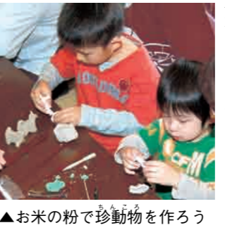
▲お米の粉で珍動物を作ろう

●与板いきいきフェスティバル 日時 11月17日(土)午前9時～午後3時30分 会場 与板体育館 内容 農林産物の即売・品評会、大豆で重さ当て大会、商工会・農協各種出店、きのこ汁の振る舞い(おわんとはしを各自持参)、もちつき大会、フリーマーケットなど