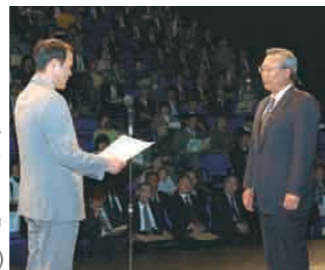
貢献 7・13水害と震災からの復興に多大な貢献のあった234の個人・団体に特別感謝状を贈呈（リリックホール・10/21）