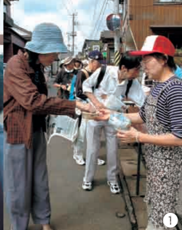
【島崎】 ①良寛ウォークの参加者をおもてなし。はちすば通りのPRも(9月29日) ②歴史ある佇いの残るはちすば通り。地元の大工さんを中心に見学。古い建築物の保存方法や再生方法を話し合いました(9月23日)