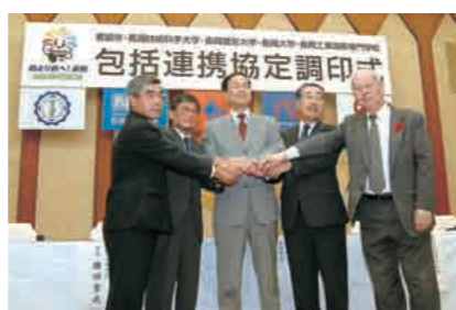
▲長岡市と3大学1高専の包括連携協定調印式(長岡市役所)

市内には、長岡技術科学大学、長岡造形大学、長岡大学、長岡工業高等専門学校があり、先端工学から経済・経営、産業・環境デザインまで幅広い分野をカバーしています。市は十月四日、これら三大学一高専と、まちづくりから人づくりまで多様な分野で相互に協力する包括連携協定を締結しました。市町村とすべての地元高等教育機関が同時に協定を結ぶのは県内初です。それぞれの機関が持つノウハウやマンパワーを、まちづくりや人材育成、企業誘致に生かします。