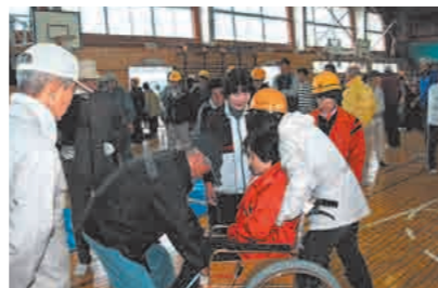
▲地区をあげての防災訓練（10月21日 四郎丸地区）

今、市内各地で自主防災会が次々と結成されています。地域の防災意識を高めようという防災訓練も活発に。日本一災害に強い都市づくりが、地域の方で着実に進んでいます。