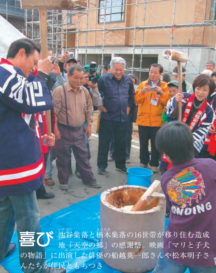
喜び 池谷集落と榎木集落の16世帯が移り住む造成地「天空の郷」の感謝祭。映画「マリと子犬の物語」に出演した俳優の船越英一郎さんや松本明子さんたちが住民ともちつき