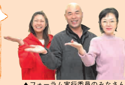
▲フォーラム実行委員のみなさん

女性や男性がそれぞれに抱える問題を、一緒に考えてみませんか。 市民の実行委員やウィルながおかの登録団体が企画・開催しています。 お気軽にどうぞ!