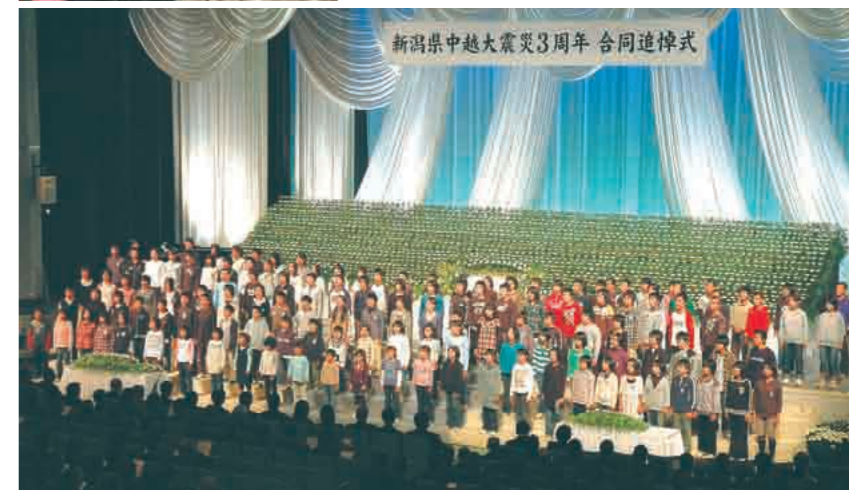
追悼 長岡市など被災7市町と県による中越大震災3周年合同追悼式。被災地の19カ校の小学生が復興を願って「故郷」を合唱（市立劇場）

希望 山古志支所から鳴り響く「希望の鐘」の音。茨城県の鑄造会社から寄贈された鐘には、「我が故郷、永遠に」と刻まれています