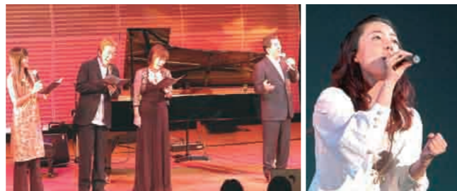
絆の歌 平原綾香さんが「Jupiter」と映画「マリと子犬の物語」の主題歌「今、風の中で」を熱唱（米百俵の群像前広場特設ステージ・右）。家族の絆、人と人との絆を歌い上げた加山雄三さん、沢田知可子さん夫妻、蘭燃さん（リリックホール・左）