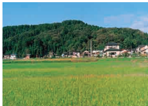
▲歴史ロマンにひたりにながら登るもよし、自然を満喫しながら散策するもよし