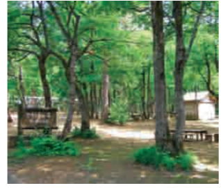
▲バーベキューも楽しめる林間広場(おぐに森林公園)

■10月31日(水)(必着)までに、住所、氏名、年齢、電話番号、愛称、マスコットキャラクター、命名などの理由を記入して、はがき、ファクス、Eメールで、〒949-5292 小国町法坂793 小国支所産業課 ☎95・5906、FAX95・2282、Eメール ogu-sangyo@city.nagaoka.lg.jp (書式自由、1通につき1点)