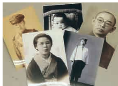
▲長岡空襲体験画と殉難者遺影展（7月18日～28日、市民センター）で展示された遺影。戦災資料館では当時の写真や資料を集めています

「空襲の翌日、栃尾の人がおにぎりを持って助けに来たという話を聞いたことがあって。被災者が八方台を越えて栃尾へ避難してきたとか、長岡のまちへ救護に行ったとか。その写真や資料が各地域に残っていると思う