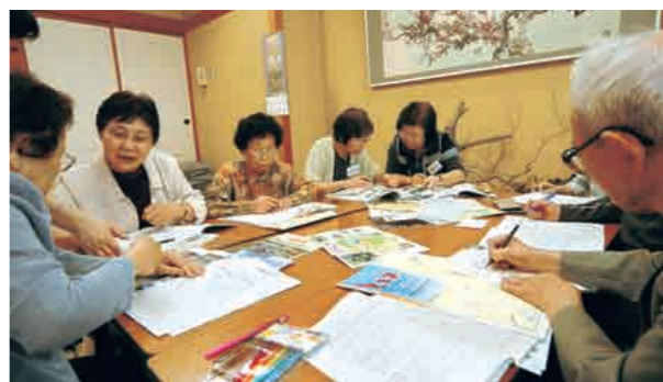
◀今年6月から栃尾地域でスタートした頭いきいき教室。集めた情報を「情報シート」に書き込んで、整理していきます

路シニアクラブは、自主的に週一回の活動を続け、旅行計画などさまざまなプランにチャレンジ。メンバーは「調べて情報を集めること、頭を使って計画を立てることがとても新鮮です。なにより、仲間に合わせておしゃべりしながらみんなで考えることが一番の楽しみ」と、元気いっぱいです。