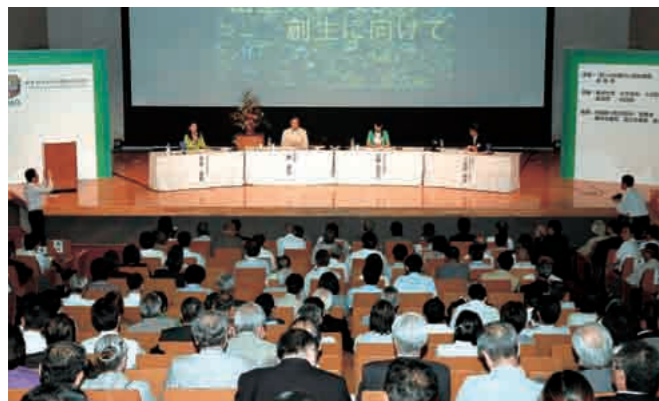
▲震災からの創造的復興と中山間地の新たな魅力の発信に向けた財団の設立記念フォーラム