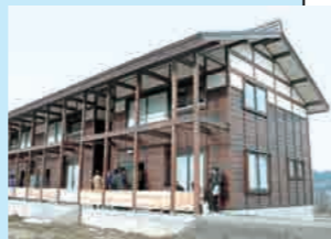
▲山古志の原風景に調和した外観で、屋根は落雪式、玄関には雪を防ぐ雁木が備えられています

震災復興への希望を託す災者公営住宅。山古志の木造住宅デザインや工法を生かしつつ、吹き抜けと採光窓で3mの積雪に覆われても太陽の光を確保できるようにするなど、環境や高齢者の生活、将来の用途へ配慮した点が評価されました。