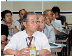
▲地域の防災リーダーを目指し真剣な表情の受講生

2期目となる今年は、中越地域に住む20歳から72歳まで46人が入学。特別講座で長岡市長が、「災害時には、冷静かつ臨機応変に対応できるかがカギ。今までのノウハウを学ぶことで、現場での応用力につなげてほしい」と話しました。