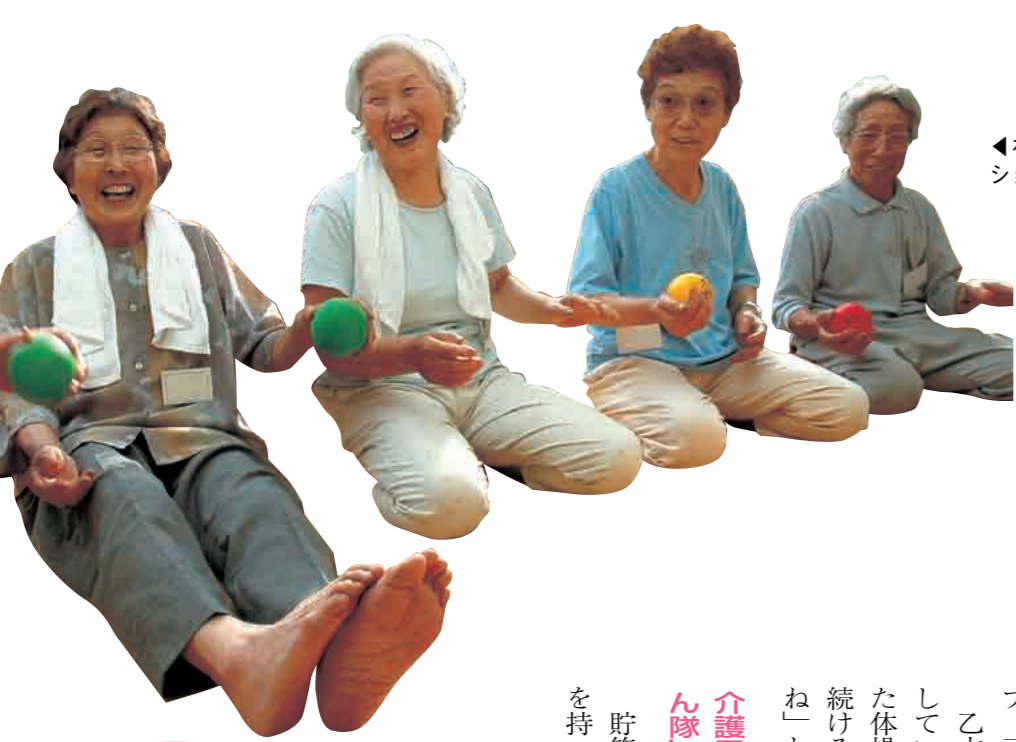
◀ボールを使ったトレーニングやレクリエーションで、心も体も鍛えます（乙吉町公民館）

ご紹介する教室などは、地域によって開催時期や時間などが違います。詳しくは介護予防推進室 ☎39・2268 または各支所保健福祉課へお問い合わせください。