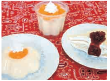
▲ミルクパバロアとクレープを作ります