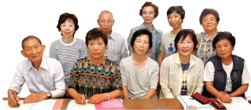
▲越路シニアクラブでは、みんなで年間の計画を立てて活動しています。今年は、ほかの地域の自主サークルとの交流会も計画。活動の範囲を広げています。

「最近、物忘れが多くなって…」 「認知症に強い脳をつくりたい」 頭いきいき教室は、そんな人たちのための教室です。グループで旅行の計画や料理のレシピなどを考えます。