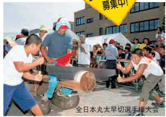
全日本丸太早切選手権大会