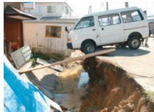
▲家の地盤が大きく沈下（東片貝町）