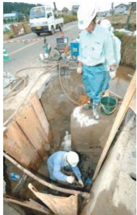
▲水道の復旧作業（浦瀬町）。ライフ ラインの復旧に全力で取り組みました。