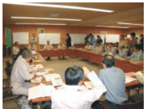
▲地震直後に災害対策本部を設置