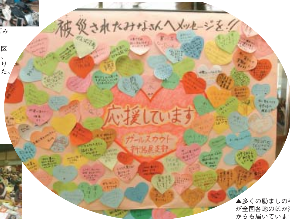
▲多くの励ましの手紙 が全国各地のほか海外 からも届いています。