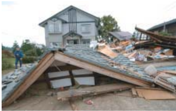
▲屋根が崩れ落ちた建物（六日市町）