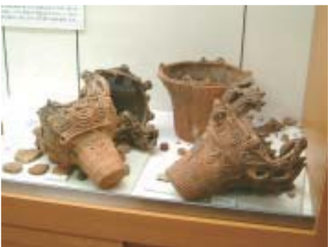
▲重要文化財の馬高遺跡出土品も破損（科学博物館）