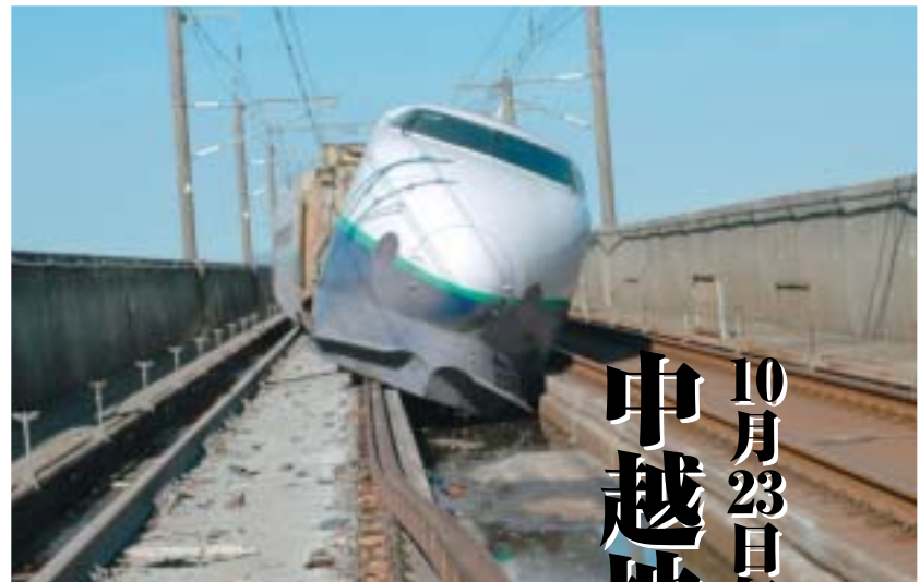
▲脱線した上越新幹線の車両