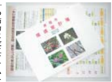
▲長岡市環境家計簿

計の節約に役立てていただくものです。平成17年版環境家計簿を12月15日(水)から市のホームページに掲載します。また、カレンダー付き家計簿(冊子)も同日から希望者に配付します。みなさんもぜひ活用してください。取り組みの優れたご家庭