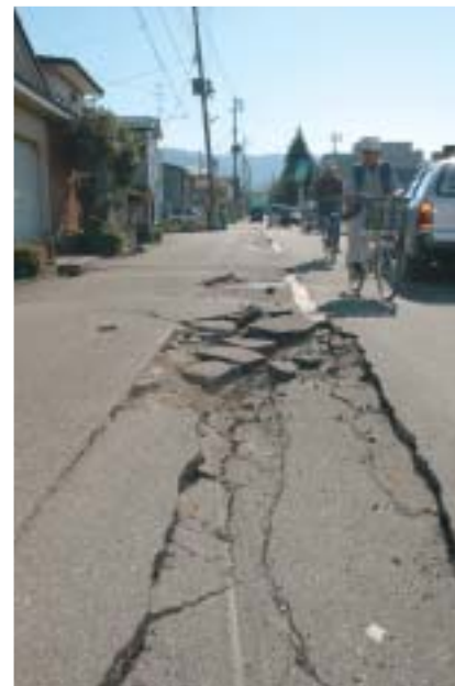
▲市内のいたるところで道路に陥没や亀裂が