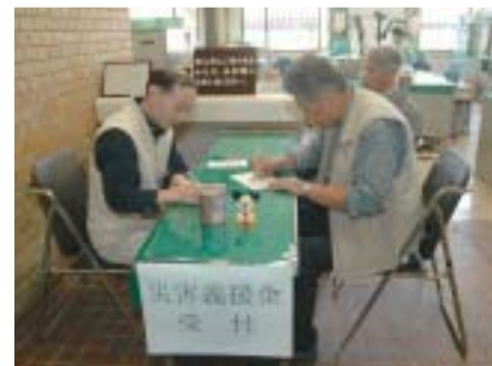
▲11月24日現在で、2億3,000万円を超える 義援金が全国から市に寄せられています。