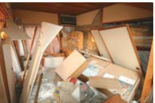
▲被災家屋の屋内（長倉町）