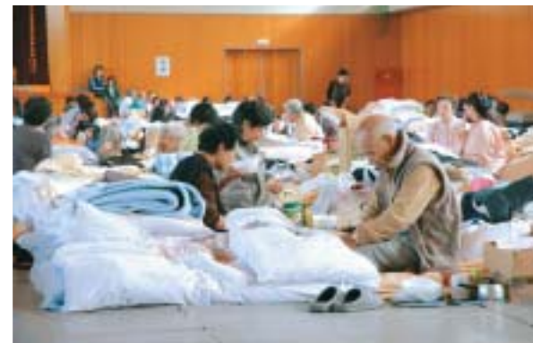
◀長引く避難所生活で被災者には次第に疲 勞の色も。