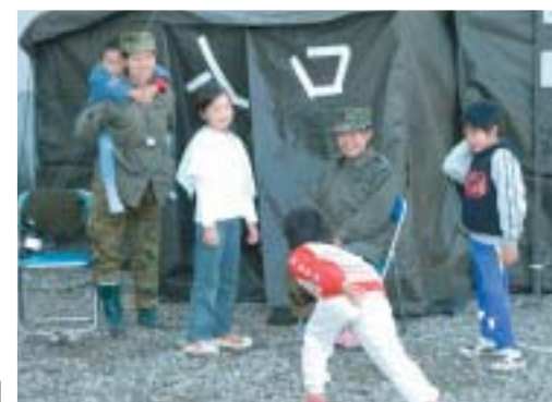
▲自衛隊員と子どもたちの交流 今回の震災では、自衛隊から人員・物資輸送、 野外風呂の設置、炊き出し、仮設テントの設営な どの支援を受けました。