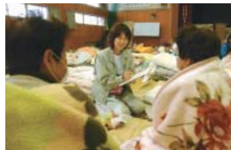
◀被害が大きい地区 に保健師が巡回し、 健康状態の聞き取り と相談を行いました。