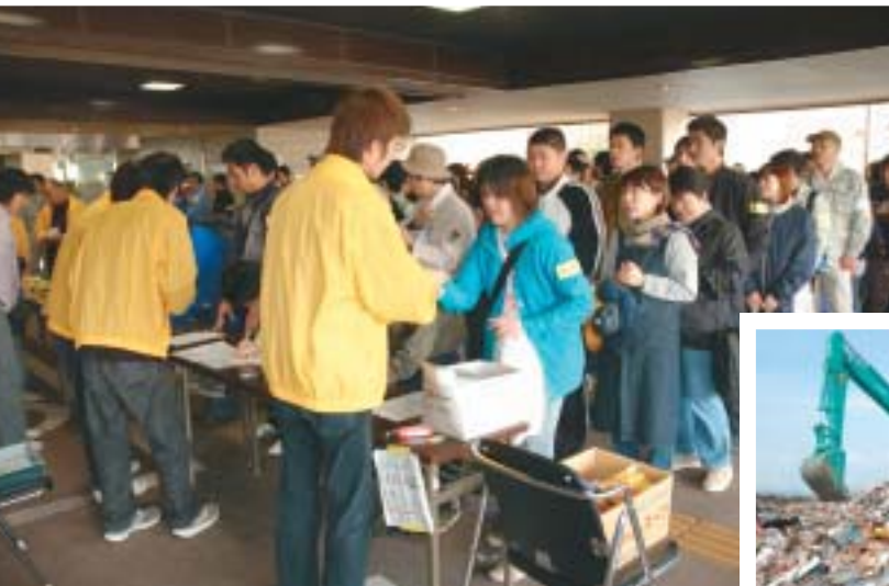
◀長岡市災害ボランティアセンター 11月24日現在で延べ1万3,159人も のボランティアのみなさんが全国から 駆けつけてくれました。また、国 や県、他自治体からも、約600団体 延べ1万4,000人を超える職員が応 援に来てくれました。