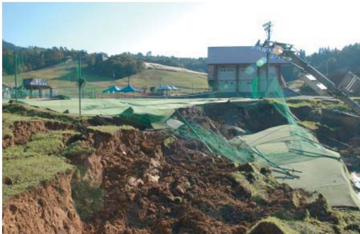
▲コートが崩落した東山テニスコート