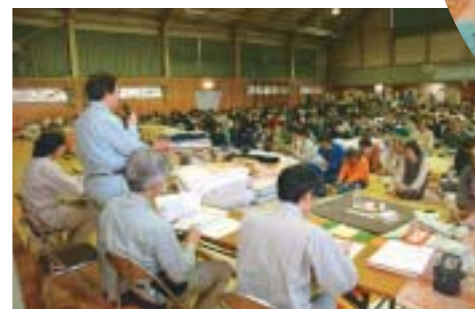
▶生活再建支援に関す る説明会（石坂小学校）