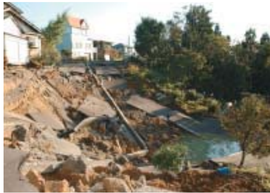
▲被害の大きかった高町団地