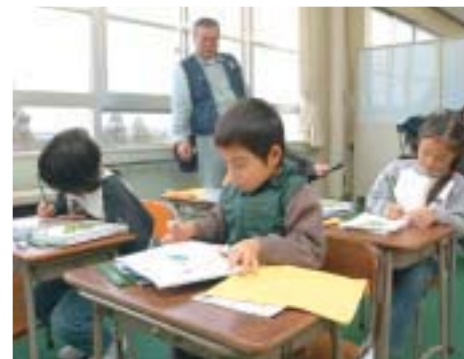
◀11月8日までにすべての小・中学校が再開。4 校がほかの学校校舎を借りての再開となりました （前川小学校での太田小学校の授業）。