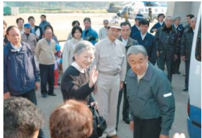
▲11月6日、天皇后両陛下が被災 者のお見舞いに長岡へ（長岡商業高 校で）