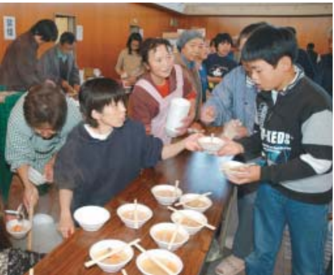
▲避難所での炊き出し（長岡農業高校）