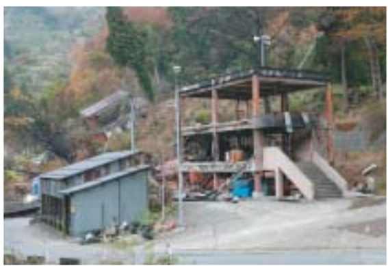
▲男の子が奇跡的に救出された一方で2人の尊い命が失われた妙見町の土砂崩れ現場 ▶濁沢町では火災と土砂崩れが発生。2人の尊い命が奪われました。