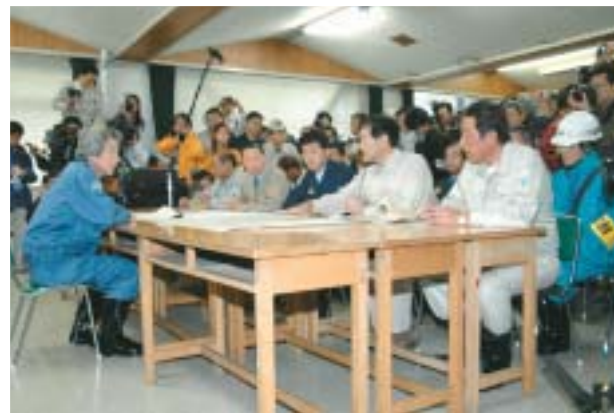
▲10月26日、小泉総理大臣が被災地を視察。森市長は被害状 況を説明し、国の支援を要請しました。