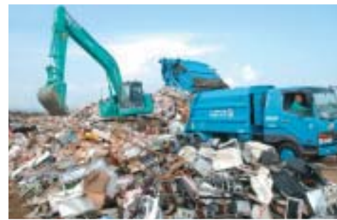
▲仮集積場所に集められた災害ごみ