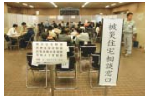
▲被災住宅の補修などの相談に多くの 市民のみなさんが訪れました（市 役所1階市民ホール）