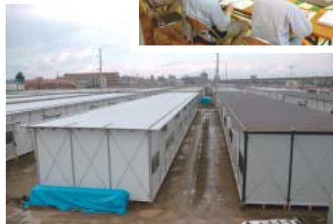
▲仮設住宅の一部が完成し、11月24日から入居が始まりました （長岡操車場地区）。